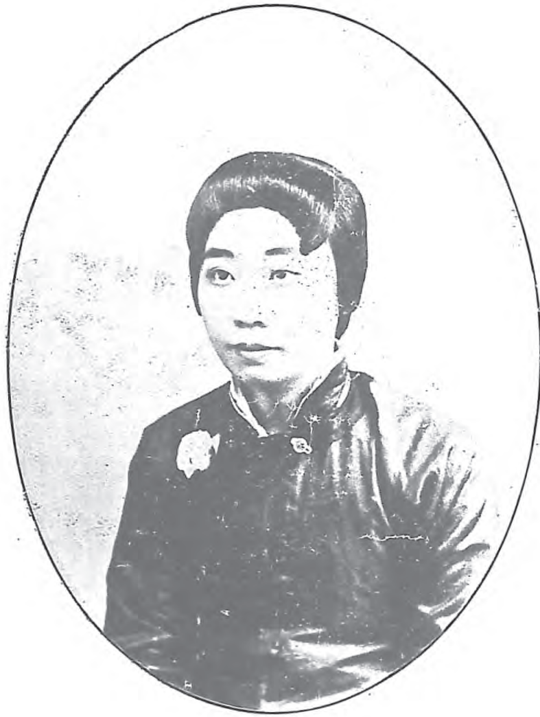
影小林林武樓二第花茶