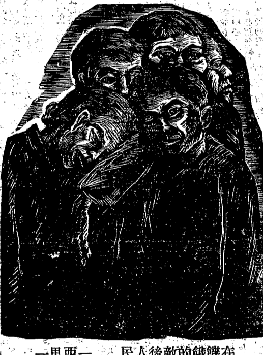
一里西 民人後敵的饋在