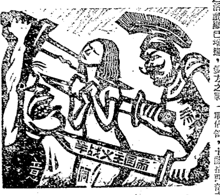
可憐的阿爾巴尼亞(加)