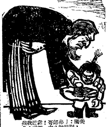
此項近來，哥羅弟，圖美... 門診下午三時至六時

【中央社雅典十三日電】希臘軍佔領巴勒摩港，希臘軍佔領巴勒摩港，希臘軍佔領巴勒摩港。