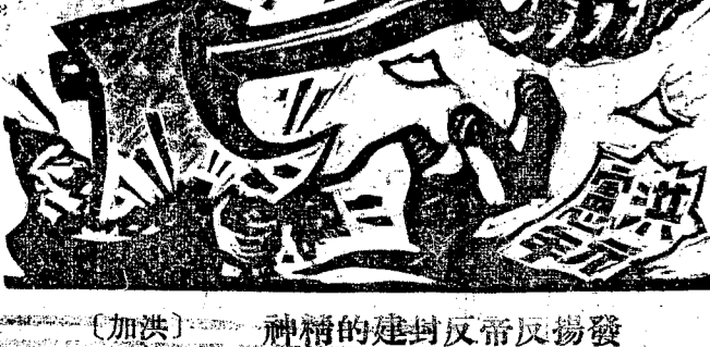
發揚反帝反封建的建國精神

五、日本無產政黨之 日本無產政黨之活動與消沉。五、日本無產政黨之。日本無產政黨之活動與消沉。五、日本無產政黨之。