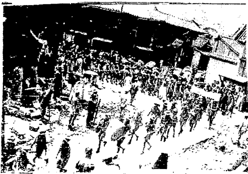
昆明學生羣衆怒吼，他個 永遠不能忘記去年的七七