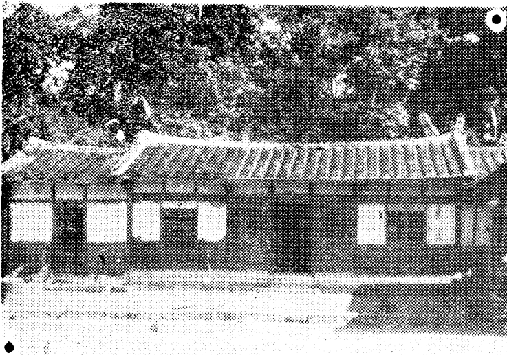
吳 鳳 宅