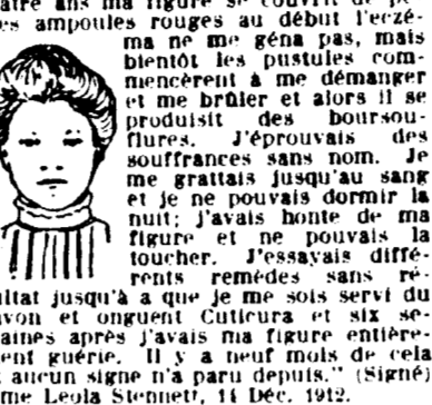
Figure couverte de pustules rouges. Démangeaisons et brûlants, grattées jusqu'au sang. Avait besoin de sa figure, guérison par le savon et onguent Cuticura.