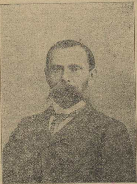
ФРАНЦІШАК БАГУШЭВІЧ (МАЦЕЙ БУРАЧОК, СЫМОН РЭЎКА з - пад БАРЫСАВА) * 1840—† 1900.

У асобі Францішка Багушэвіча беларускае пісьменьніцтва сярэдніх часоў мае самую вызнач- ную сілу, вага якой яшчэ ня зусім дасьледжа-