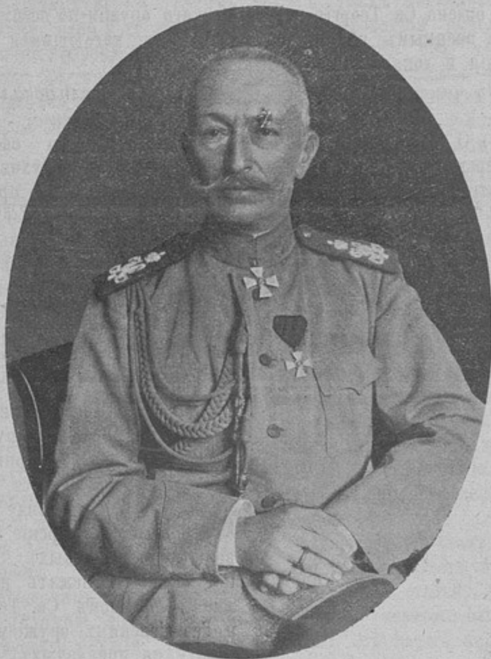
Генераль-адъютантъ, генераль-отъ-кавалеріи Алексѣй Алексѣевичъ БРУСИЛОВЪ, главнокомандующій арміями юго-западнаго фронта.