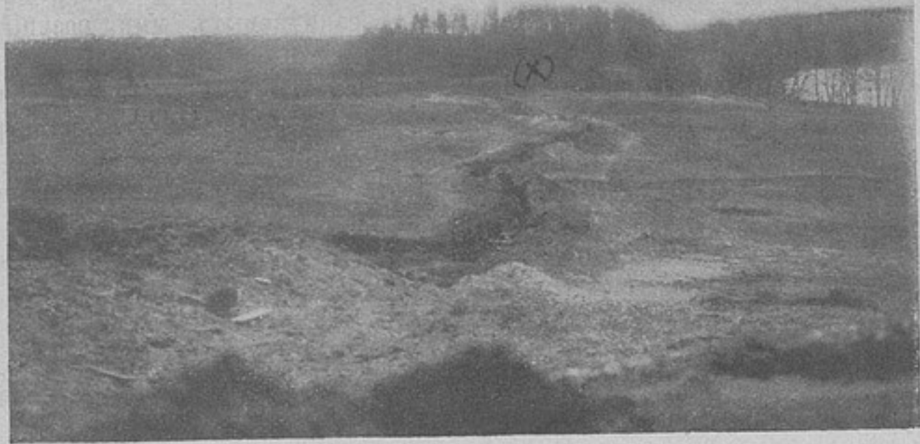
Ходъ сообщенія отъ землянки командира баталіона.

въ приемѣ городомъ высокой своей гостии. Нѣтъ ни шпалеръ войскъ на улицахъ, ни почетнаго караула, ни депутацій на вокзалѣ. Царственныя гости пріѣхали какъ сестры тѣхъ, кто терпѣлъ, кто видѣлъ смерть, поэтому и одѣянія ихъ соответственныя: темно-коричневое платье, бѣлый передникъ съ краснымъ крестомъ на груди и большая бѣлая косынка, обрамляющая лица, вдоль бровей, щекъ и самага подбородка. Какъ и въ тотъ разъ лишь кое-гдѣ иллюминація, флаги, портреты въ окнахъ. И счастливы Х-вы, что благодаря позднему времени не видно продѣлокъ туманной сырой погоды, грязи на улицахъ, которой не было ни возможности, ни времени убрать, иначе ужъ очень неблагоприятное впечатлѣніе произвелъ бы Х. на Царскую Семью. Медленно, плавно бѣжитъ моторъ, освѣщенный ярко внутри. Высокое счастье возить въ своемъ моторѣ Государыню съ дочерьми выпало на долю губернскаго предводителя дворянства. Сзади другой со свитой, состоящей лишь изъ трехъ приближенныхъ особъ. И восторженная густая толпа, толкаясь и тѣсня другъ друга въ грязи на улицахъ, видитъ три нѣжныхъ, обрамленныхъ бѣлымъ, лица Царственныхъ сестрицъ, привѣтливо кивающихъ въ отвѣтъ на несмолкающій ея восторгъ. Въ соборѣ архіерейское служеніе недолгое, лишь краткое молебствіе. Дамы стоятъ еще болѣе густой и поэтому шумною толпой, онѣ уже освоились вполнѣ съ Царскими пріѣздами, помилуйте, второй разъ въ столь короткій срокъ, и поэтому чувствуютъ себя еще болѣе независимыми.