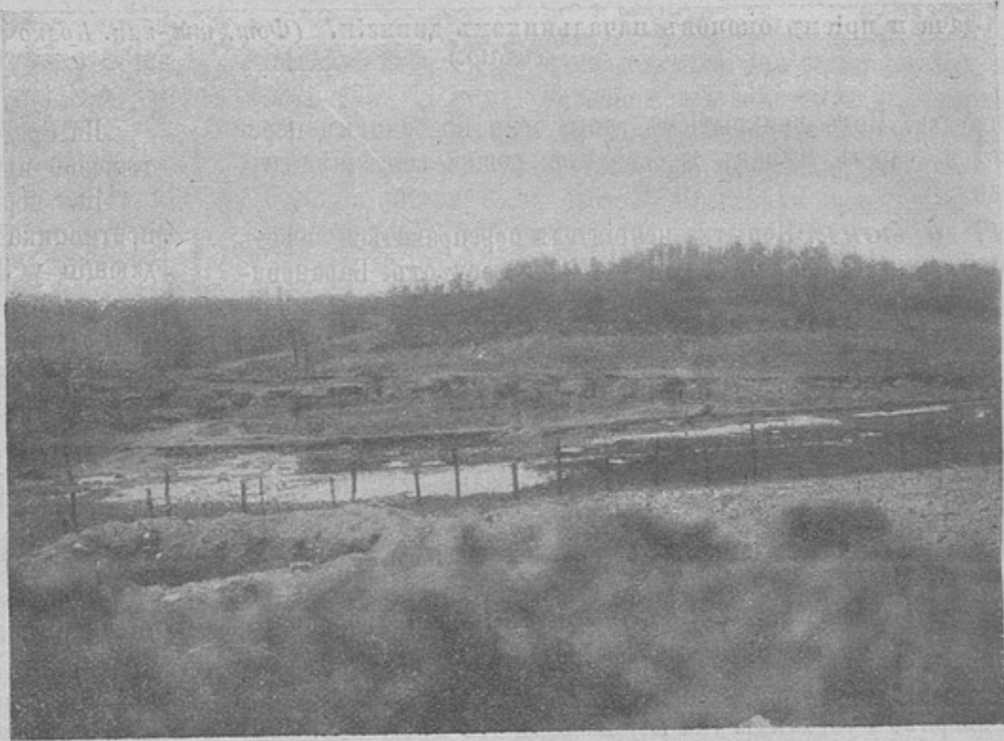
Въ окопахъ въ районѣ Двинска.

Въ районѣ къ сѣверо-востоку отъ Выгоновскаго озера вчера утромъ германцы повели наступленіе на фольваркъ въ 5 верстахъ юго-западнѣ м. Липскъ, но были отбиты. Въ 12 час. дня противникъ возобновилъ здѣсь наступленіе,