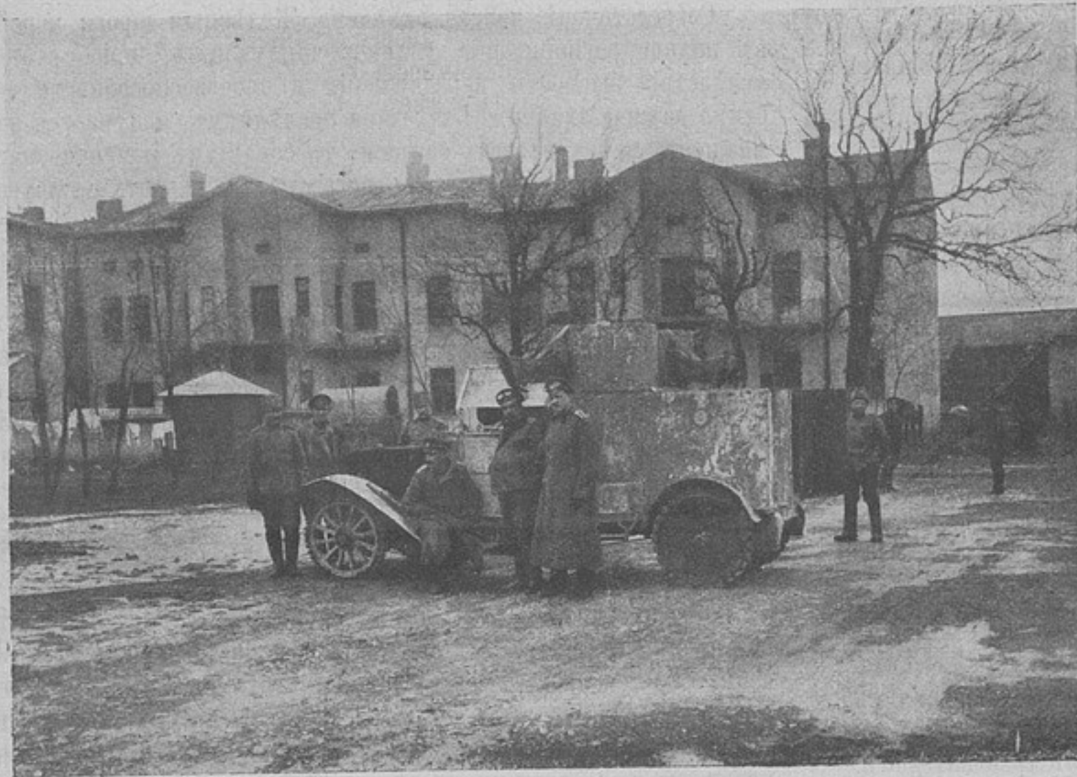
Бронированный автомобиль „Слава“.

Такимъ образомъ при эксплуатаціи линіи № 2, несмотря на то, что время нахождения поѣздовъ въ пути увеличивается въ пять разъ, передвиженіе всего отряда потребуетъ вдвое меньше времени, чѣмъ если бы мы оказали предпочтеніе