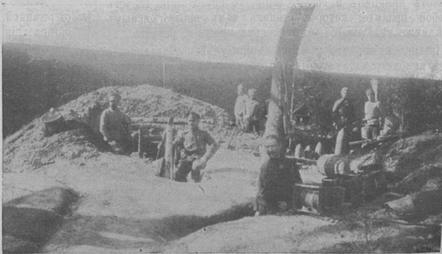
Блиндажъ командира 2-го баталіона N полка. Справа не разорвавшіяся нѣмецкіе снаряды.