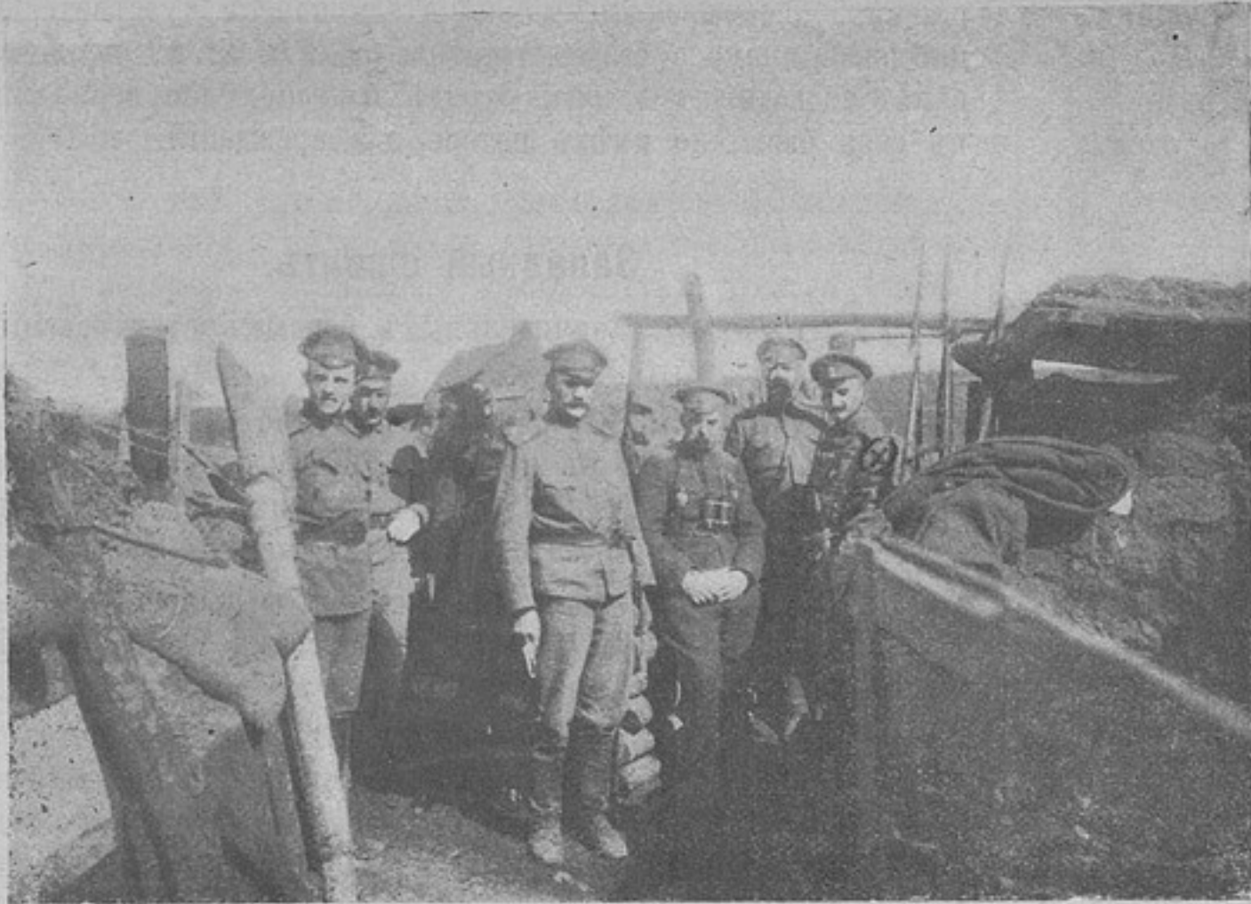
Сдача и прием окопов начальником дивизии.

Новогрудка. Под прикрытием этого огня противник переправился через Немань и овладел рощей восточнее дер. Гнесичи.