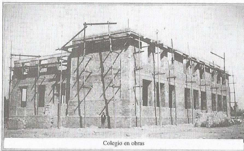
Colegio en obras

La construcción se realizó en dos años, a finales de Enero de 1935 la "Asociación Amigos del Niño" en Asamblea adopta el siguiente acuerdo: