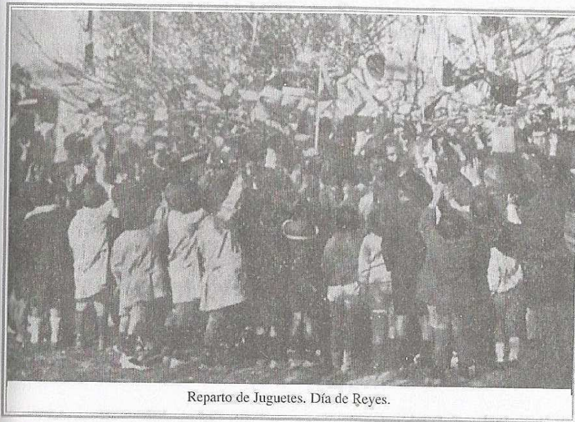
Reparto de Juguetes. Día de Reyes.

La labor de esta asociación es envidiable, y los vecinos del barrio con sus donativos consiguen que ésta siga adelante.