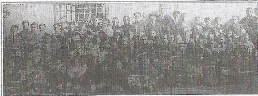
Niños de la escuela. Archivo Municipal de Cartagena revista Carthagonova año 1927

Seguimos en el año y mes anteriormente mencionado. Han transcurrido 5 años desde que el solar para la construcción del colegio fuera entregado a La Junta Local de Protección a la infancia, la cual no ha cumplido con lo acordado. El colegio tiene el nombramiento provisional de Escuela Graduada, director nombrado, le faltan maestros para cubrir todos los grados de la enseñanza, y el proyecto para la construcción del colegio.