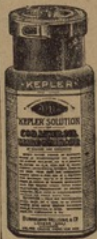
شكل مصغر جداً

محلول ، كبلر ، ذو طعم شهى كاجود انواع العسل