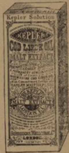
شكل مصغر جداً

محلول ، كبلر ، يستعمل بغيره كبرى الالامات المرضعات وخاصيته انه يقوى بنية الام ويساعدها على افراز كمية عظيمة من يترتب على اللبن وذلك نمو الطفل كثيراً