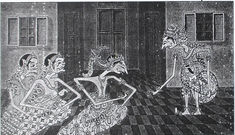
ပြောလှမ်းထိလေ့ရှိကုမ္ပဏီကုမ္ပဏီ

ယခုကုမ္ပဏီများသည် ကုမ္ပဏီများကို ဝယ်ယူရန်အတွက် မြို့ပြအရပ်အရပ်သို့ ဝယ်ယူမှုများ ပြုလုပ်နေကြောင်း သိရှိရပါသည်။