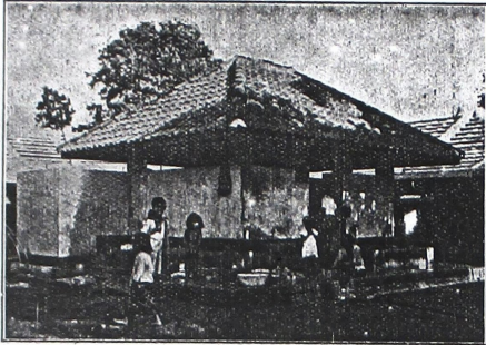
ဤကဲ့သို့... နေရာက အသေ... သေချာစွာ... နေရာက အသေ...