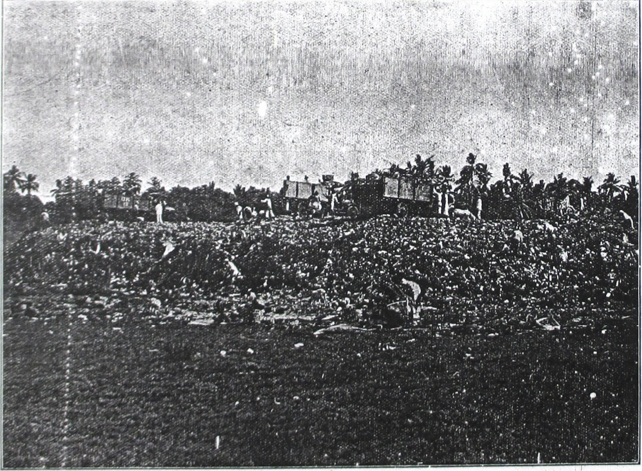
ဤကဲ့သို့... နေရာက အသေ... သေချာစွာ... နေရာက အသေ...