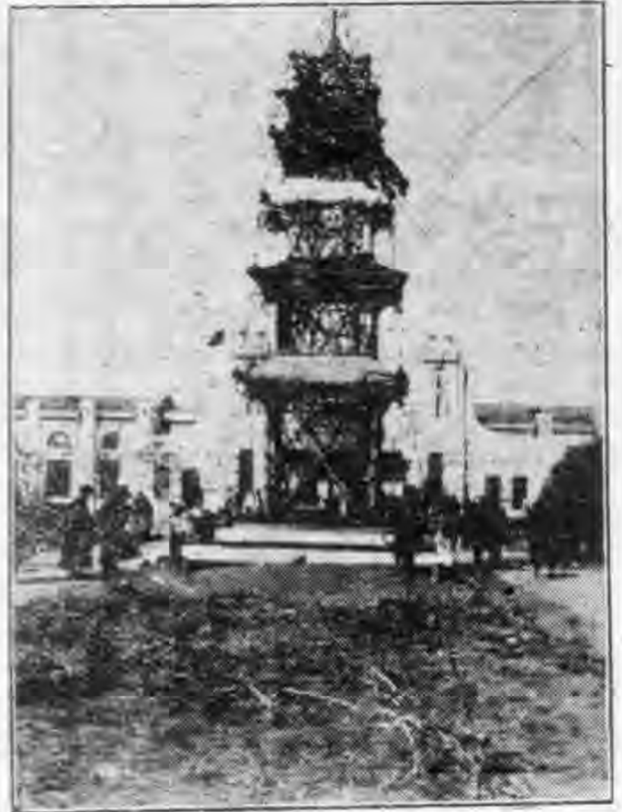
去年三月一日哈爾濱偽滿慶祝建國紀念於車站前所搭之彩塔

三月一日的早晨，就傳令各商號懸掛偽旗，表示慶祝；在禮場門前並交叉日偽旗各一面，而示為日本之保護國。屆時，除日偽新貴先後到場點綴外，並在事先由警察挨各商戶，嚴令每戶必須派代表參加慶祝，並發有黃色布條之入場證，且威嚇不參加將受處分。所以也略有前去應卯者。但此猶不足，更派警察至各小客棧，用拉夫式之手段，並誘以二三角錢之代價，使令參加偽慶祝大典。不過，日偽雖然一方大事舖張，一方却又得提心吊膽，防範民衆暗殺事項，所以在禮場之四週密佈便衣隊，保安隊，及日軍而示防範。雖然如此周密，而日偽新貴列席者，僅是二三路角色匆匆從事點綴而已。提燈