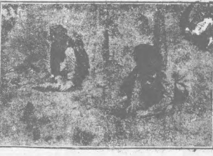
田園多事：此為田園多事之照片，顯示一羣人在戶外活動。