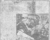
意大利飛機抵京時之光景

意大利飛機抵京時之光景 意大利飛機抵京時，機場上聚集了大批民眾。飛機降落後，民眾紛紛湧向飛機，場面極為熱烈。飛機上之機員，亦受到民眾之熱烈歡迎。此次飛機抵京，標誌著意京兩國之友好關係進一步發展。