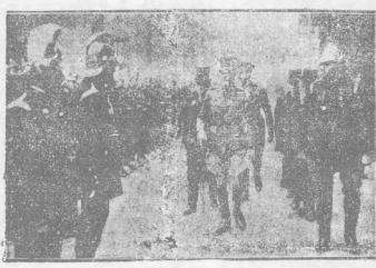
英皇儲之國防火隊