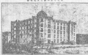
警察廳大之新科科科科

幻術幻。此為今日中國最切要之問題。幻術者。即魔法也。魔法之幻。則人心之幻。人心之幻。則世界之幻。此其理之顯然者也。然今日之中國。魔法之幻。則人心之幻。人心之幻。則世界之幻。此其理之顯然者也。