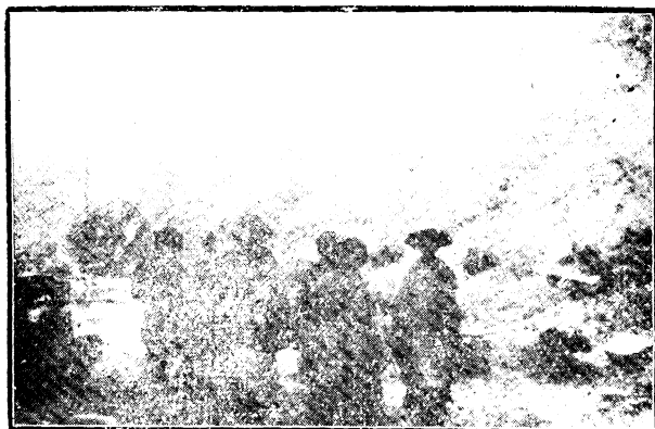
形情場趕山下女婦居山族夷