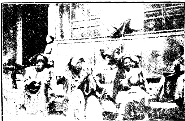
越夷婦在漢族市席地紡織毛線情形