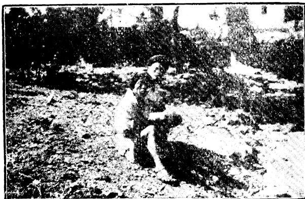
此系越夷族除黑白夷外所稱水田也是