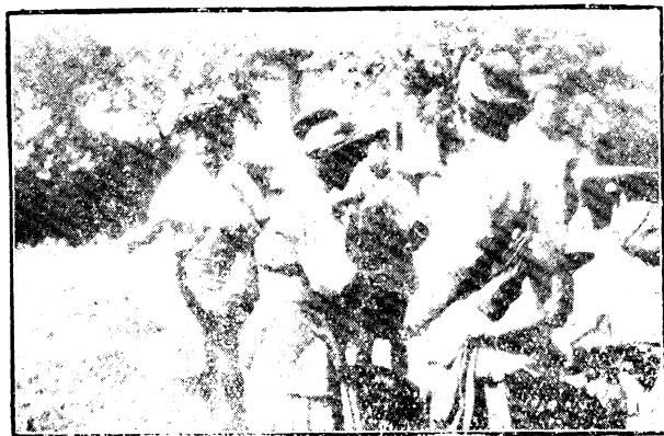
形情物易物以易交女男族夷源鹽