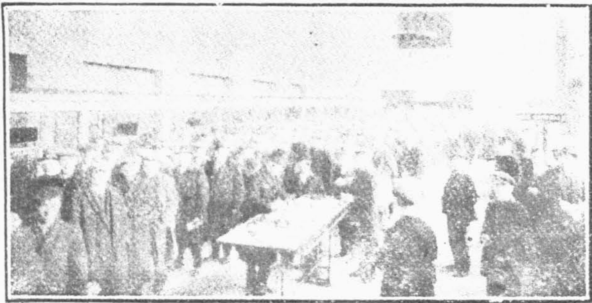
福 特 工 場 職 工 往 銀 行 存 款 時 的 光 景