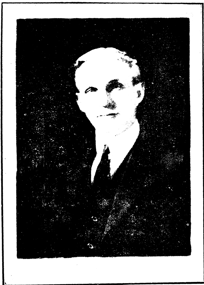
像 肖 特 福 利 亨