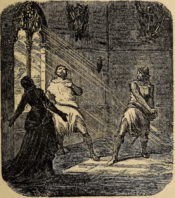
Acte II. Escena final.