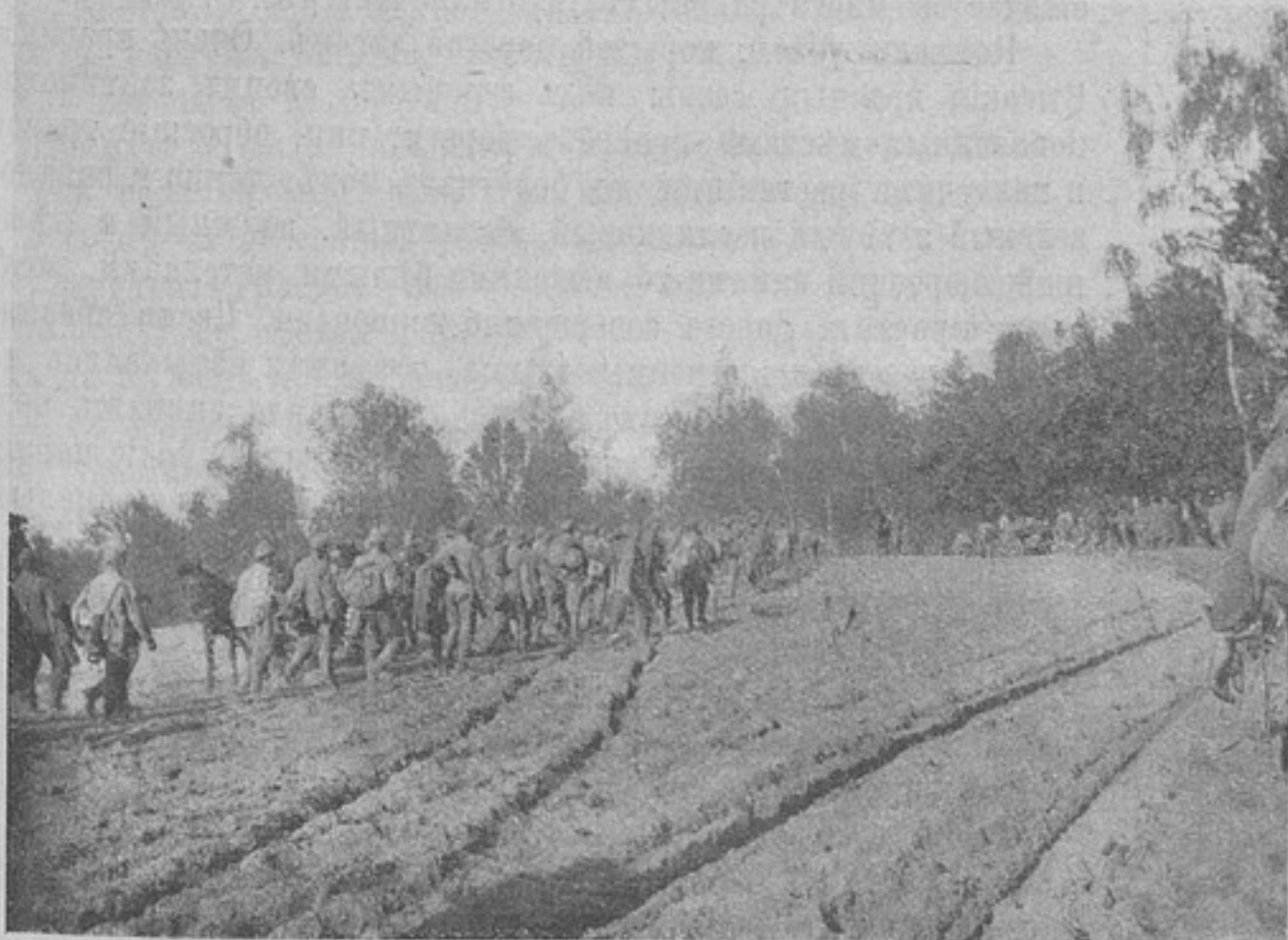
Свѣжіе плѣнные... 21-го мая 1916 г.

Потомъ вѣтеръ перемѣнился и понесъ насъ на нашу сторону. И такъ нѣсколько разъ, причемъ шаръ опускался то ниже, то поднимался выше... Нѣмцы усердно его обстрѣливали, но, къ