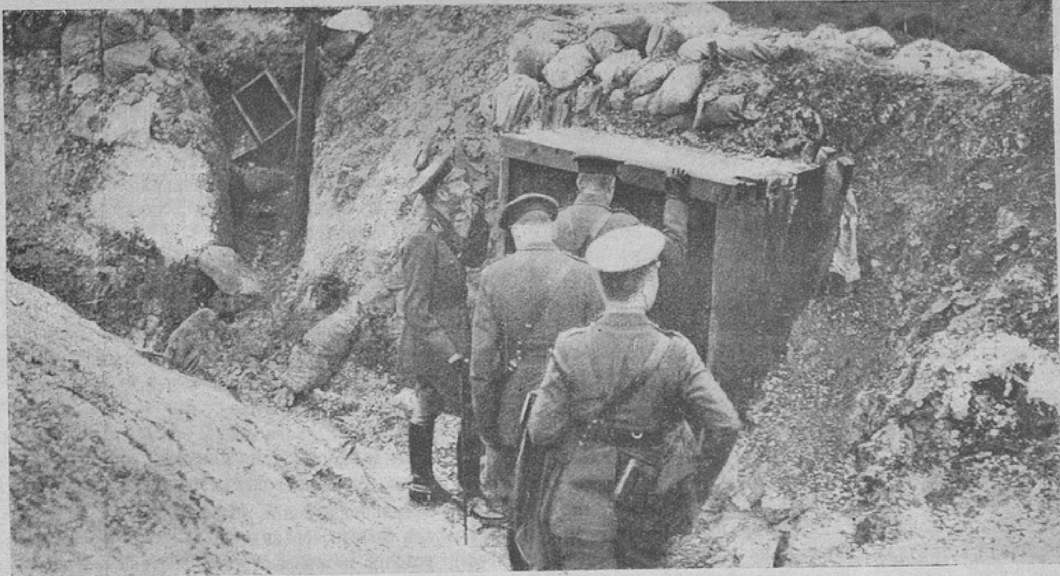
Посѣщеніе Англійскимъ королемъ нѣмецкихъ окоповъ, взятыхъ англичанами.

гдѣ-то за дер. Островъ на лѣвомъ берегу Сана. Густые, бѣлые клубы дыма быстро взлетѣли къ ярко-голубому небу. Затѣмъ раздался глухой звукъ очень сильнаго, невиднаго намъ взрыва, откуда-то снизу. Повидимому, это былъ разрушенъ послѣдній мостъ, соединявшій Перемышль съ его предмѣстьемъ, Засаньемъ.