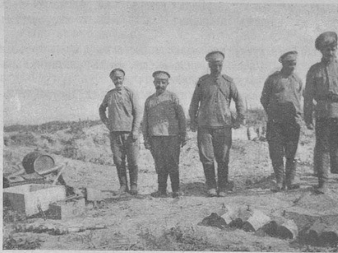
Бомбы и ручные гранаты.

— Нѣмцы чи мадъяры чего тось въ поля біднымъ людемъ насовали, — даетъ онъ своеобразное объясненіе случая, произошедшаго въ дѣйствительности отъ разрыва артил-