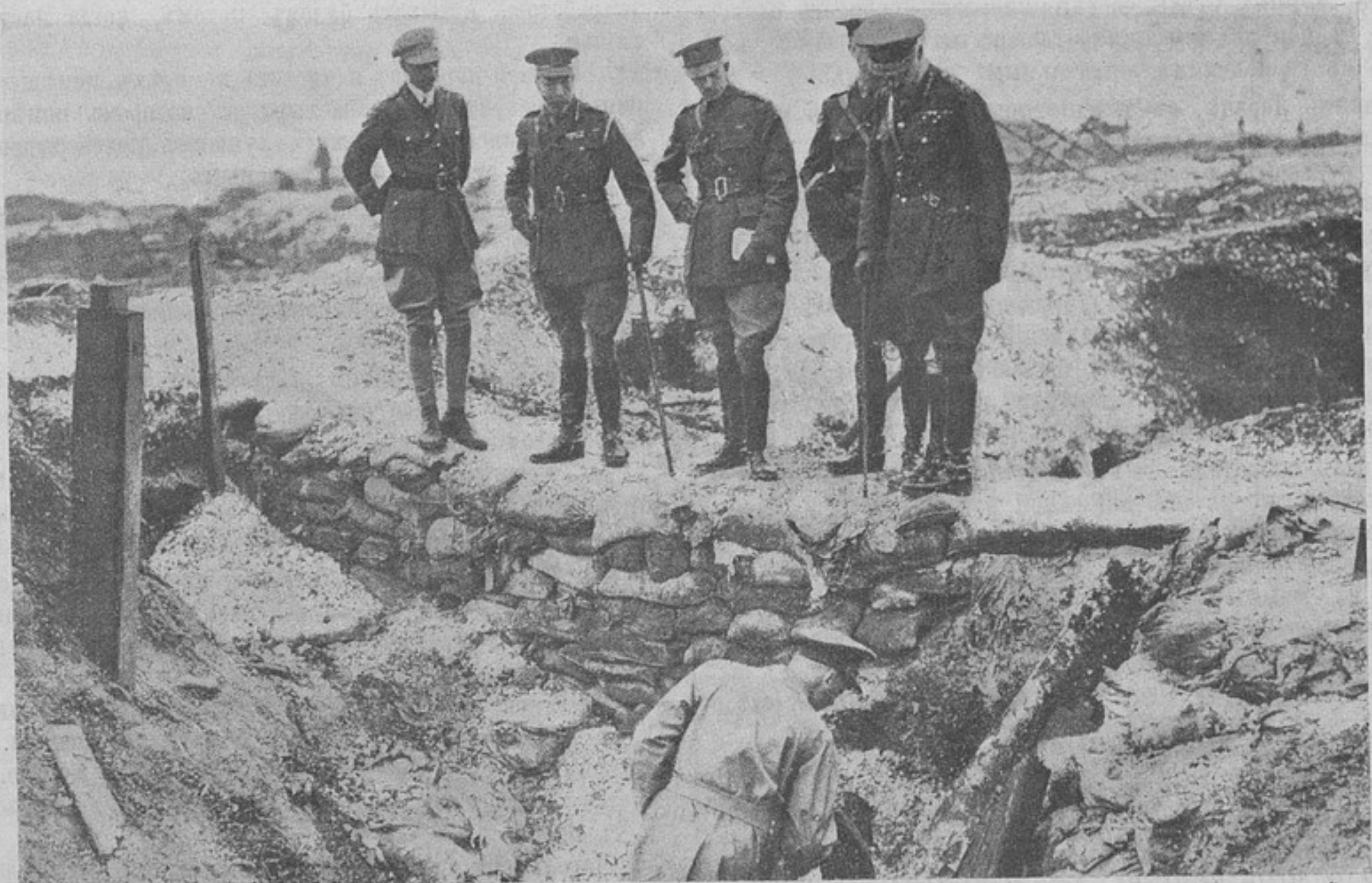
Осмотръ кородемъ Георгомъ окоповъ у Фрикура, взятыхъ англичанами.

По ночамъ холодъ давалъ себя знать, а клубящіеся туманы поднимались изъ всѣхъ болотъ и низинъ, закрывая густою пеленою всѣ окрестности.