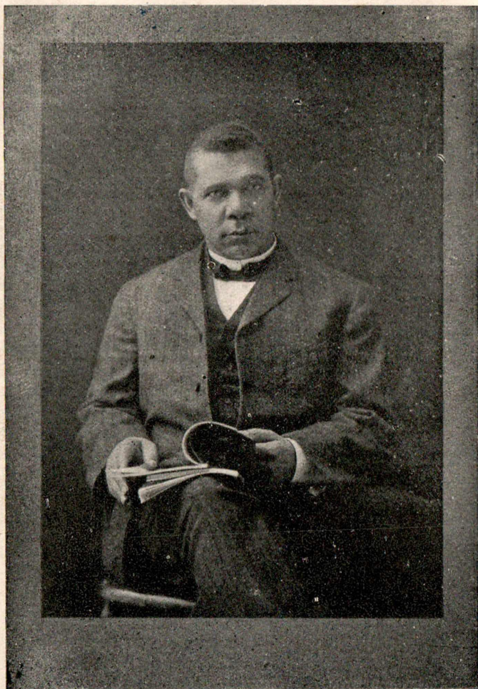
बुकर टी. वॉशिंग्टन.