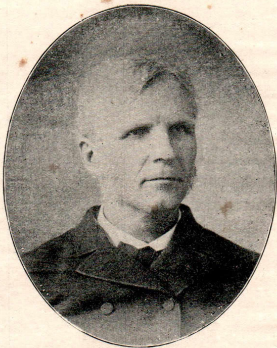
जनरल एम्. सी. आर्मस्ट्रांग.