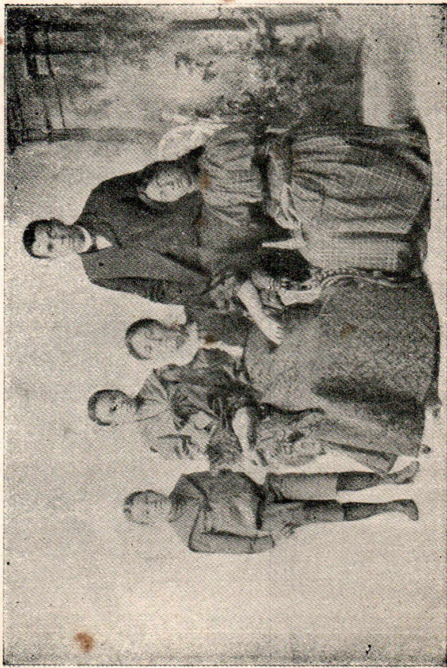
बुकर टी. वॉशिंग्टन आणि त्यांचे कुटुंब.