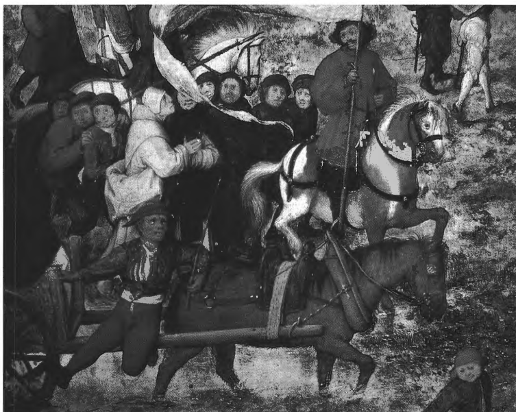
Detail uit de kruisdraging van Christus Schilderij door Pieter Bruegel de Oudere, 1564. Wenen, Kunsthistorisches Museum.

Bruegel toont zich hier eens te meer als de geniale observator van de buitenmensen, van het land en de samenleving waarin dit volk zich volgens de harde wetten van het lot een bestaan zoekt. Kleurrijk beschrijft hij de vormvergroving, de populaire bombarie waarin in zijn tijd alle volksleven – en de kerk stond in het midden daarvan – zich uitte.