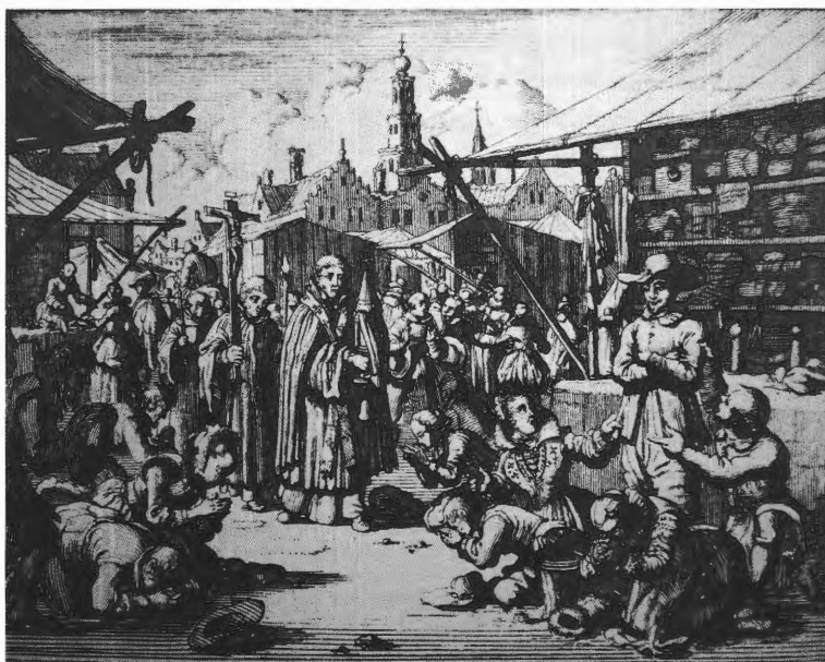
De uitgang van de Sacramentsprocessie Gravure door Jan Luyken, 17de eeuw.

De voorbijtrekkende processie wordt verstoord door iemand die weigert neer te knielen. Luyken was de uitmuntende illustrator van de religieuze dissidentie in de 16de eeuw.