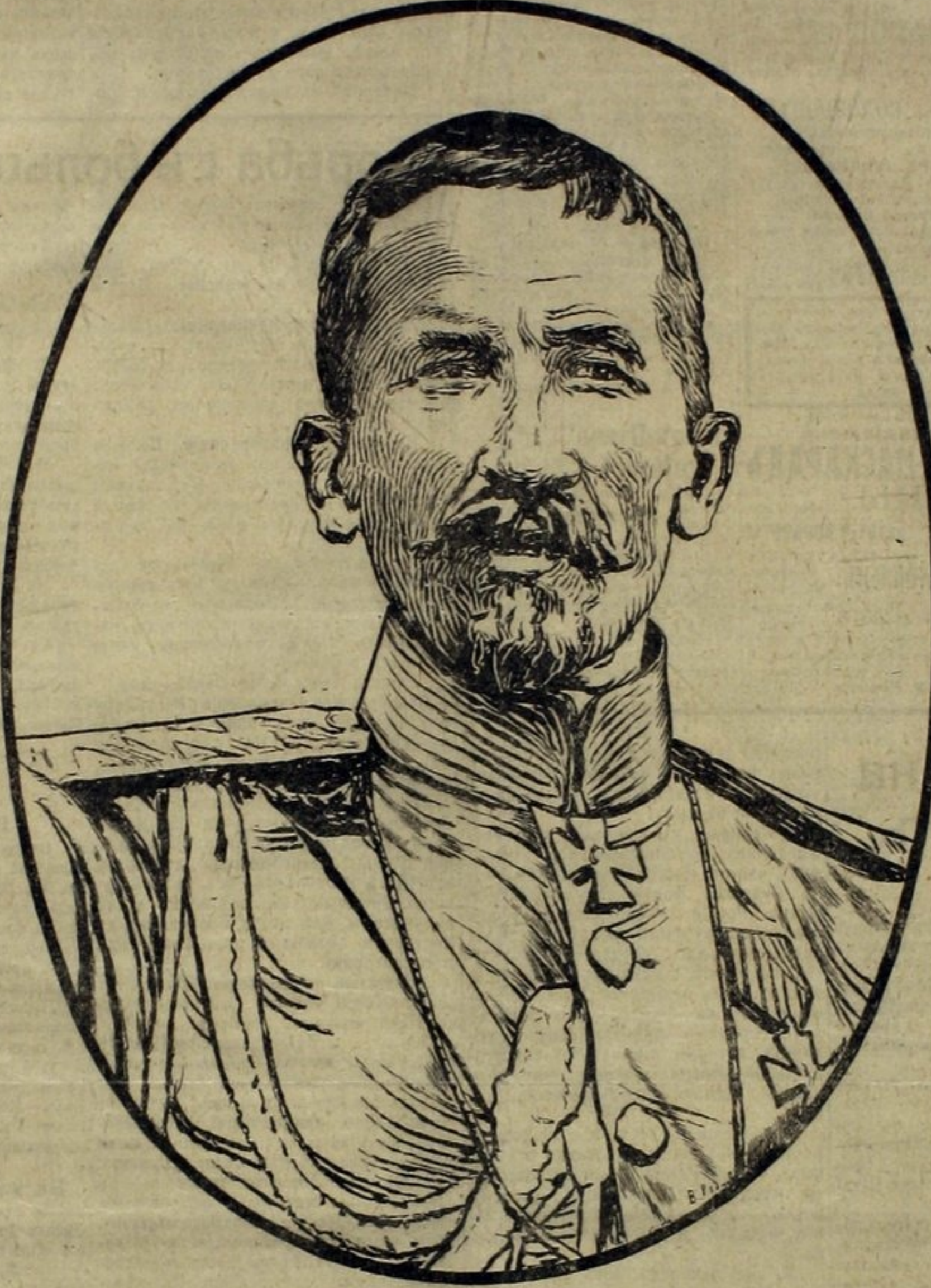
ГЕНЕРАЛЪ Лавръ Георгіевичъ Корниловъ.

Мы ковровъ разстлать на балконахъ своихъ Не могли-бъ, если-бъ даже хотѣли, — Реквизицией лучшее взято у насъ, Что похуже, мы сами проѣли.