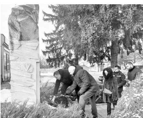
Макарівська селищна рада