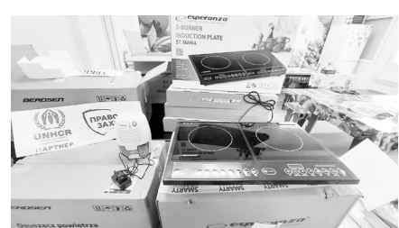
Макарівська селищна рада