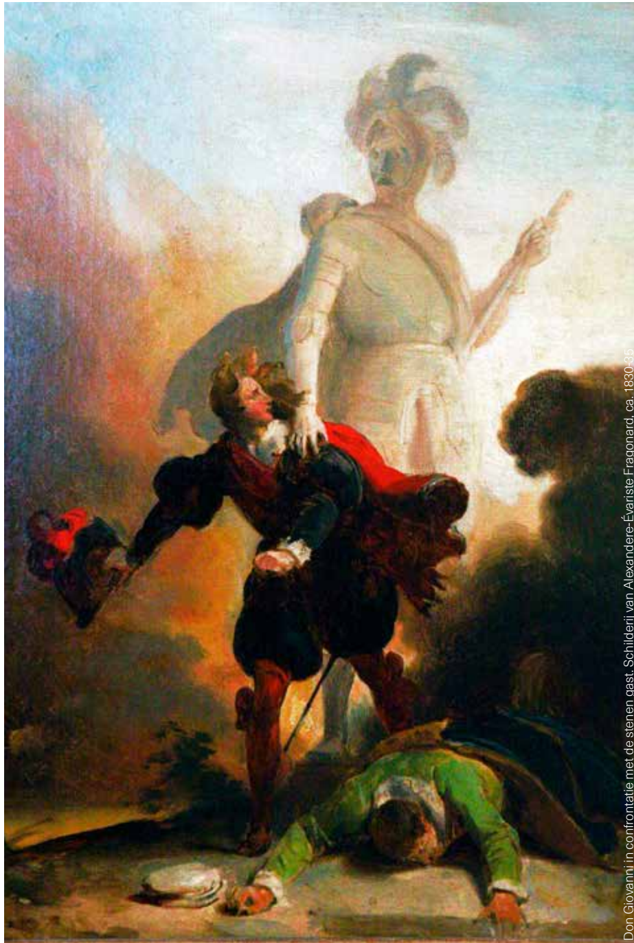
Don Giovanni in confrontatie met de stenen gast. Schilderij van Alexandre-Evariste Fragonard, ca. 1830-35