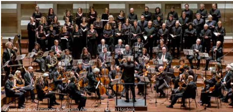
Orkest van de Achttiende Eeuw & Cappella Amsterdam