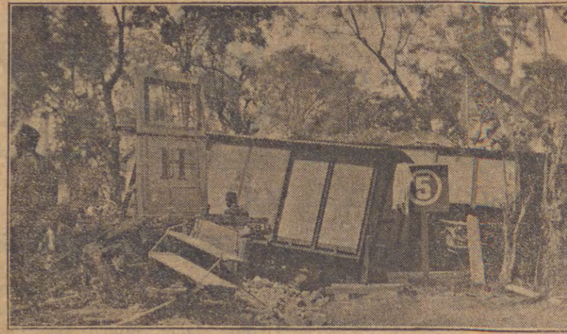
Di sini keliatan bagimana S. S. poen tida loepoet dari karoekan. Wagen G.R. 8042 keleuar dari rail.