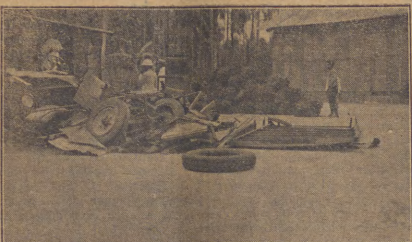
Ini ada lebih teges, bagimana autobus „Tan Lim“ soeda djadi roeroentoek. Roda-roda itoe autobus terpentak sana-sini.