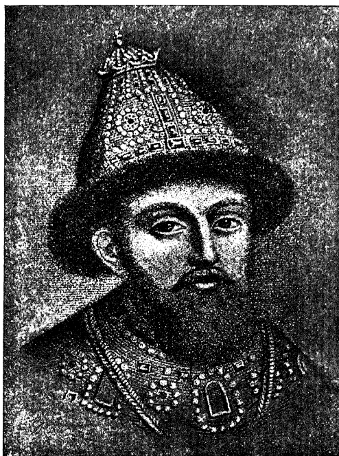
Царь Михаилъ Феодоровичъ. 1613—1645 г.г.