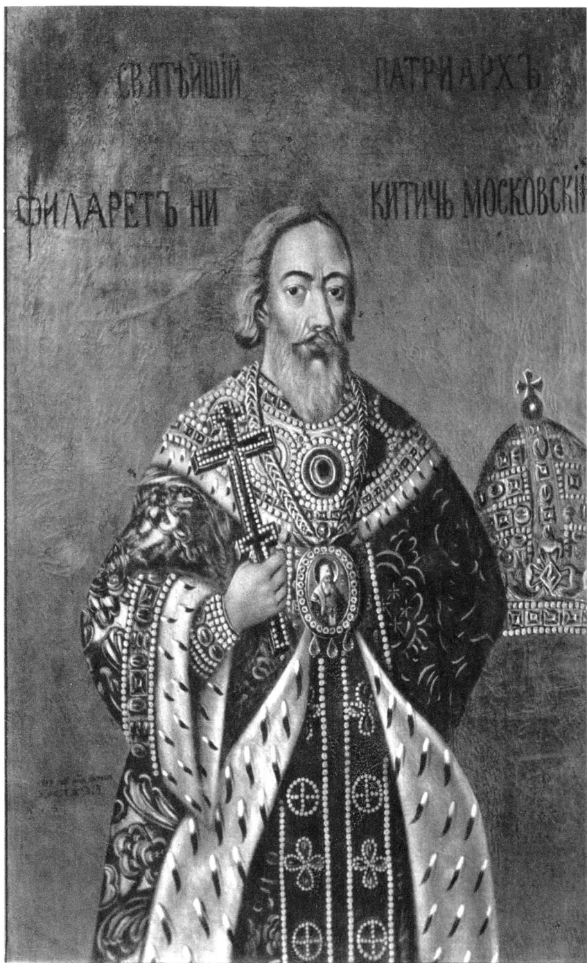
Фото-тинто-гравюра Т-ва „Образованіе“.

Филаретъ Никитичъ Романовъ патріархъ Московскій и вся Русі.