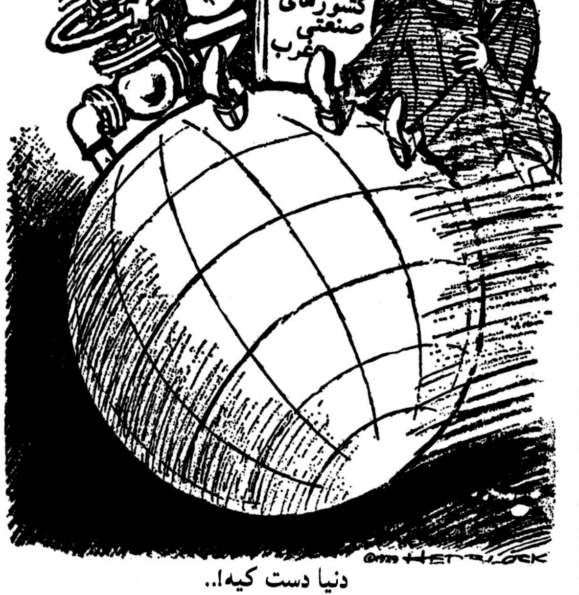
دنیا دست کیه... (The world is in the hands of whom...)

درد که بطور کلی قابل دستمندی به دو قسمت است: علم و عدل به عبارت دیگر صاحب امر در هر زمینه بایستی عالمترین و عادل ترین باشد.