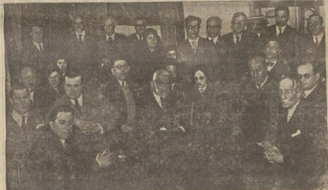
Dün Maarif Müdürlüğünde yapılan içtimaa...

Şehrimizdeki lise ve ortamekteplerdeki bütün türkçe ve edebiyat muallimleri dün akşam saat 17,5 da maarif müdürlüğünde bir içtima yapmışlardır. Bu toplantıya Darülfünunun ve lise edebiyat profesörleri de iştirak etmişlerdir. Söz derleme faaliyetinde mucibi tereddüt görülen bazı noktalar üzerinde münakaşa cereyan etmiş ve Cemiyet umumî merkezinden