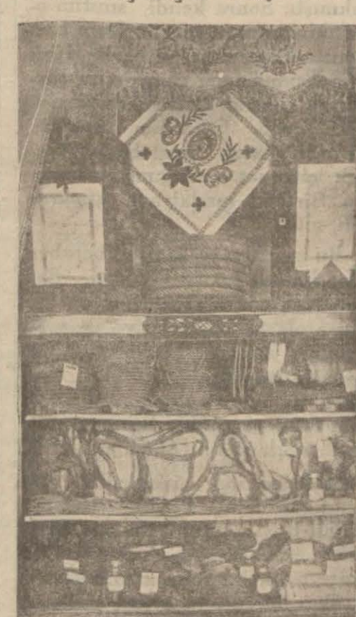
Kastamonuda imal edilen urganlar

raddesinde istihsal edilen kendir ve Vilâyet haricine bir buçuk milyon kilo urgan ve muhtayibi satışı yapan bu sanayi memleketinin başlıca ticaretini teşkil etmektedir. Son iki ay zarfında İstanbulla kıliyyetli miktarda kendir ihraçatı yapılmış ve yapılmakta bulunmaktadır.