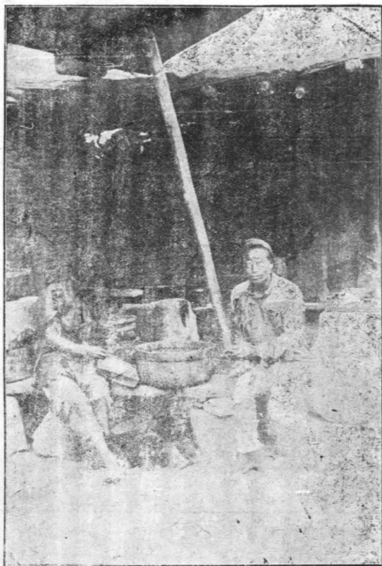
山西文水縣災民之狀況