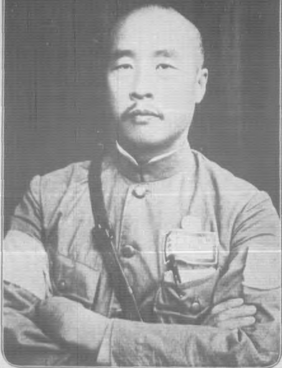
韓 委 員 復 樂