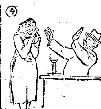
(4) 自言會下柳，平生拒惠，未生女風，嘗有。