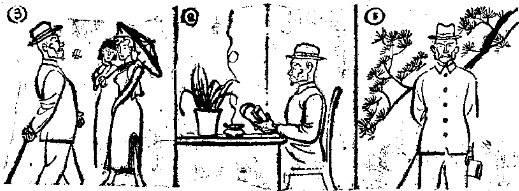
視邪不目路行 (3) 。也禮非因，