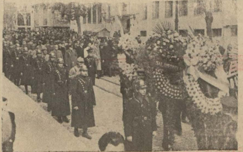
(Yazısı 5 incide)