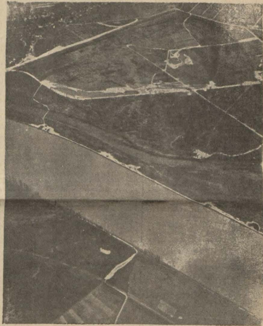
Zigfrid istihkamlarının bulunduğu sahanın İngiliz tayyareleri tarafından alınan fotoğrafı

Erzincan, 5 (A.A.) — Sıhhiye Vekili zelzele mntakasında tetkikatta bulunmak üzere Erzincan valisi B. Osman Nuri Teke. li ile birlikte bugün saat 19.10 da Tercana hareket etmiştir.