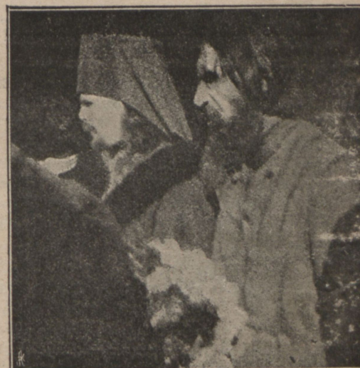
Иеромонахъ Иліодоръ и старецъ Распути