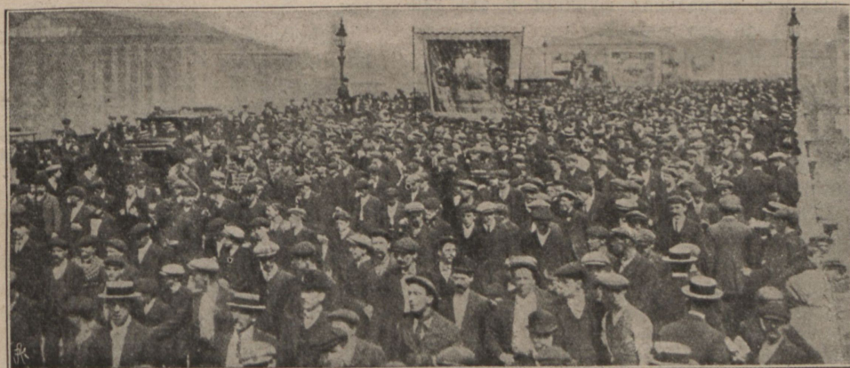
Демонстрація на улицѣ Лондона.