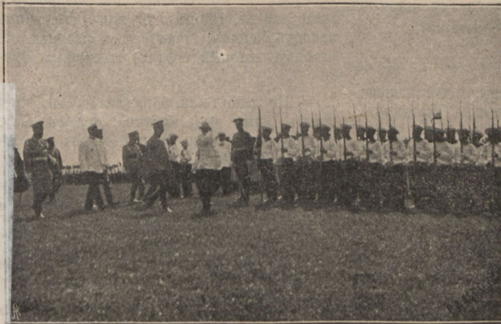
Прохожденіе „потѣшныхъ“ церемоніальнымъ маршемъ.