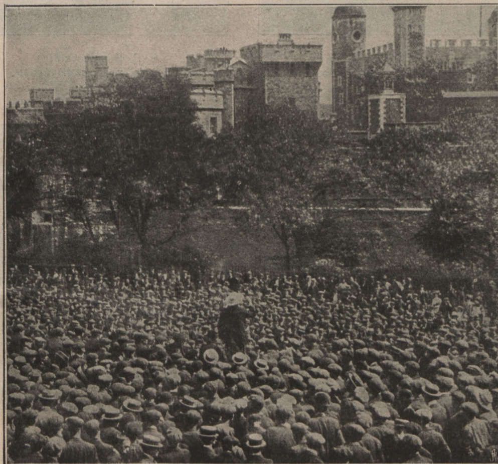
Митингъ въ Лондонѣ.