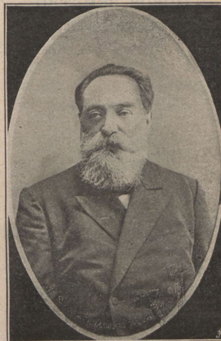
Проф. Д. Я. Самоквасовъ (+).