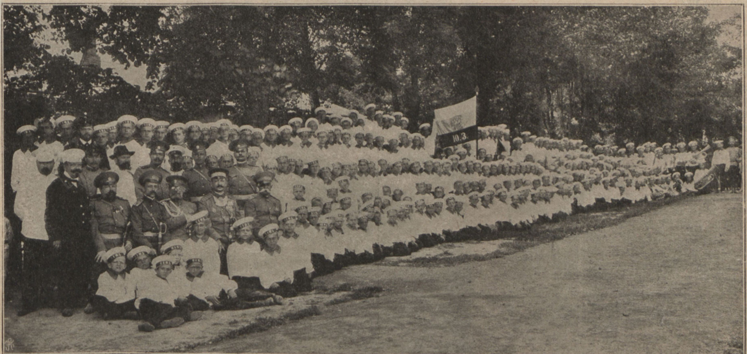
Группа „потѣшныхъ“ жел.-дорожн. училищъ.