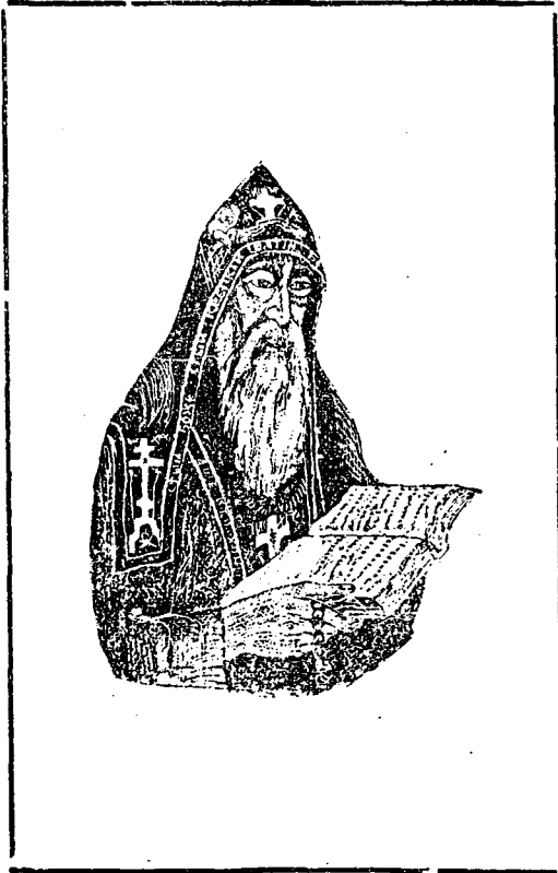
Старецъ Геросхимонахъ Нилъ

Пишущій сии строки имѣеть счастье быть келейникомъ и ученикомъ того старца (схи-игуменъ Нилъ), который, въ свое время, самъ былъ келейникомъ у под-