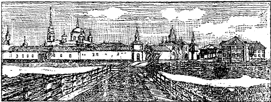
Видъ Нило-Сорской пустыни.

Нило-Сорская пустынь или «Ниловъ скитъ» въ то время не имѣла своей самостоятельности, но была приписной къ Кирилло-Бѣлозерскому монастырю и съ внѣшней стороны представляла груды развалинъ. Изъ зданій монастырскихъ на возвышенномъ бугрѣ, насыпанномъ руками пр. Нила и его учениковъ на низменной болотистой почвѣ, тѣснились двѣ небольшія ветхія церкви, одна во имя Срѣтенія Господня, другая—во имя св. Іоанна Крестителя, ограды вокругъ церквей не было никакой, небольшія ветхія келліи стояли накренясь близки къ паденію, скотный дворъ, погрязшій въ болотѣ, лежалъ въ развалинахъ, а также всѣ остальные хозяйственные зданія обители представляли картину разрушенія. Внутреннее состояніе обители было