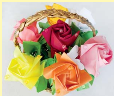
"Квіти для матусі". Світлана КОНОВАЛЕНКО, 4 клас