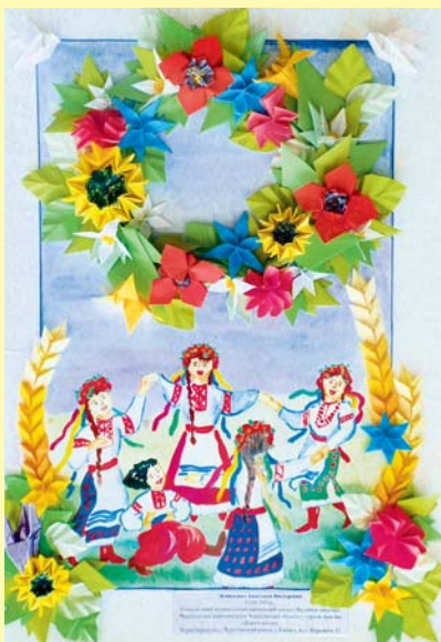
"Дорога квітів". Анастасія ДЕМИДЕНКО