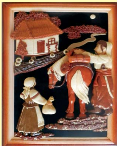
"На захист рідної землі". Оксана СКОТАРЕНКО