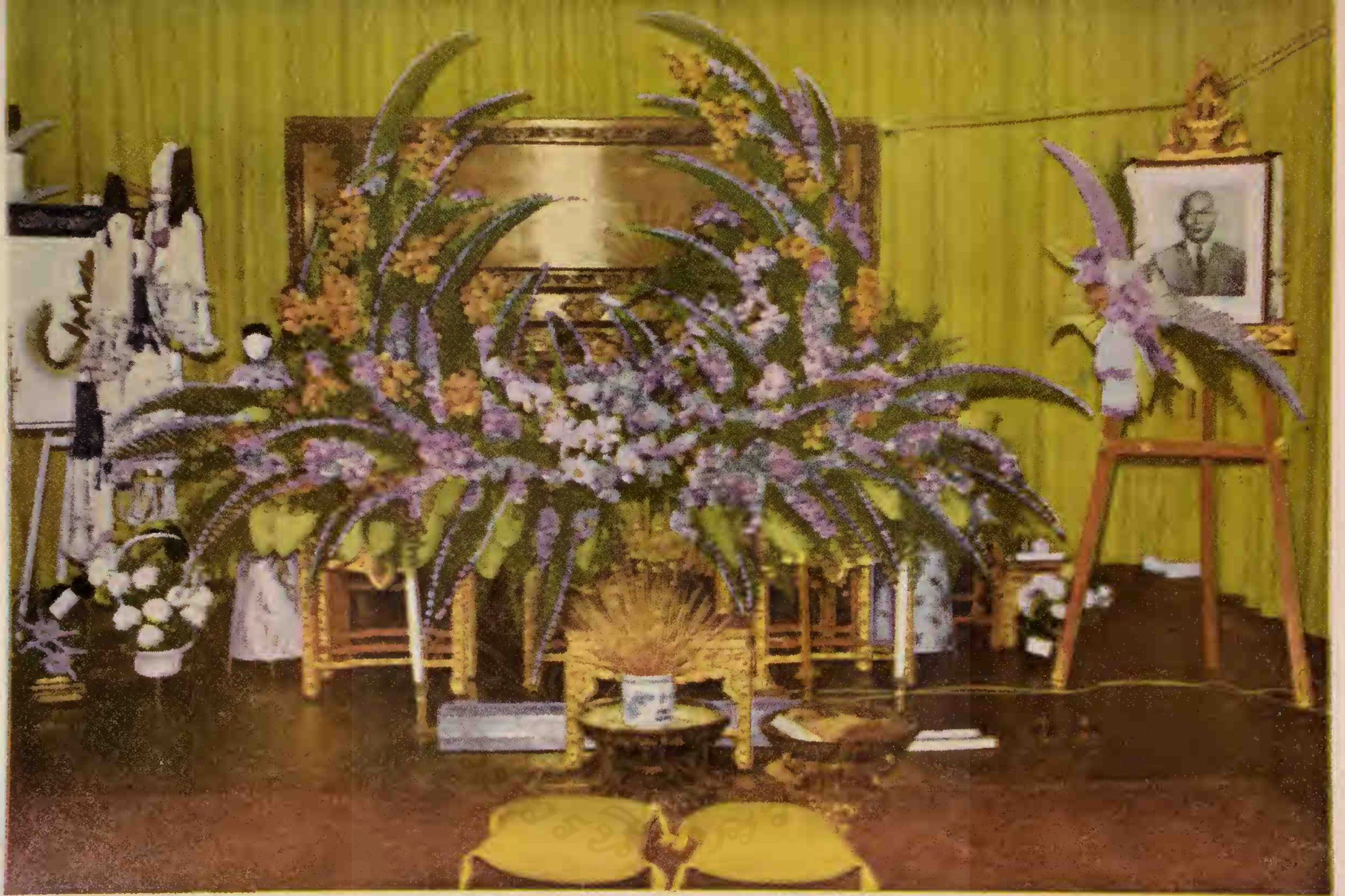
ตั้งศพบำเพ็ญกุศล นายชน พรธณเชษฐ์ ณ วัดเทพศิรินทราวาส วันที่ ๒-๘ มีนาคม ๒๕๑๓