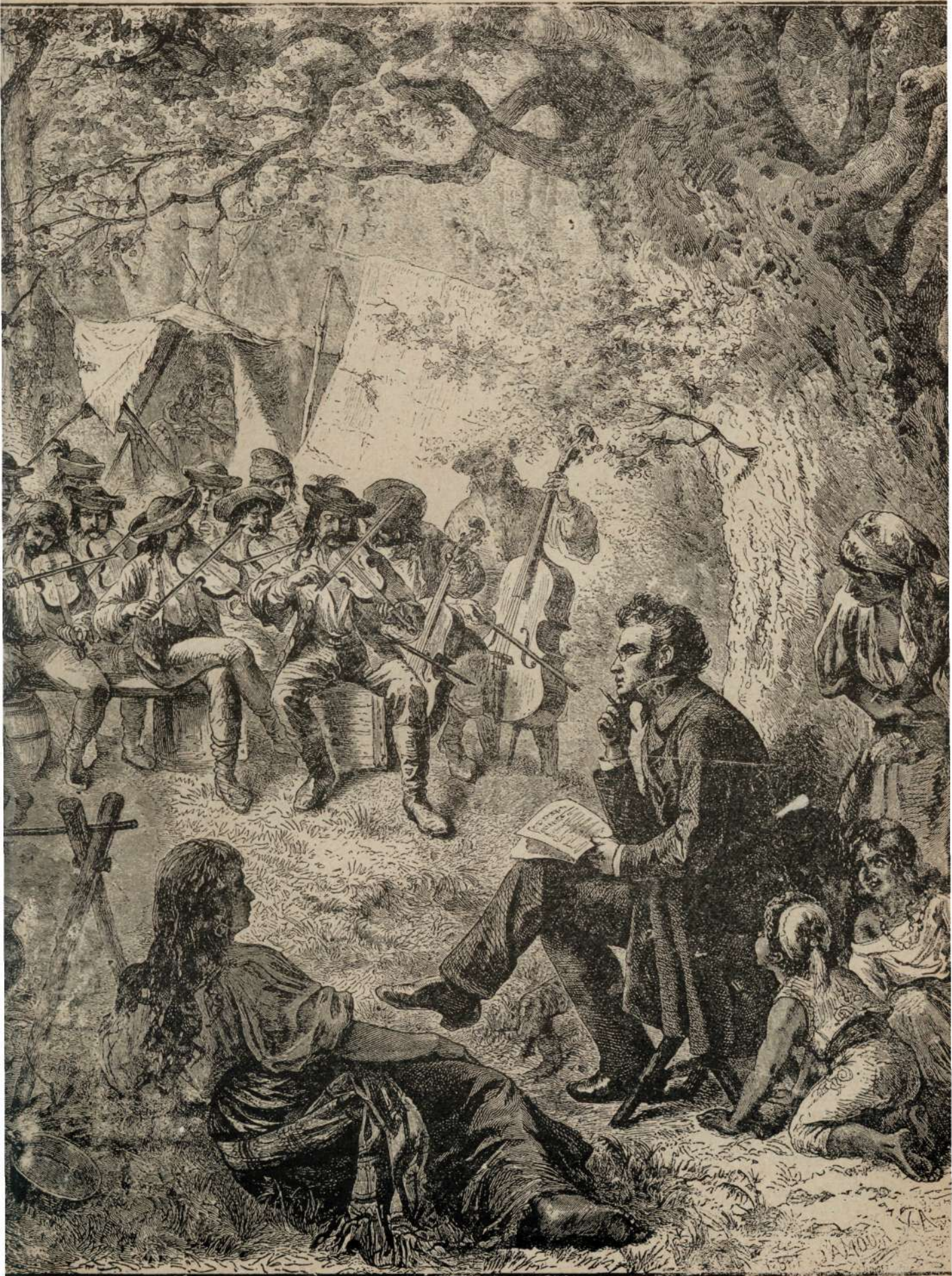
Unu artistu intre musicantii de sate.