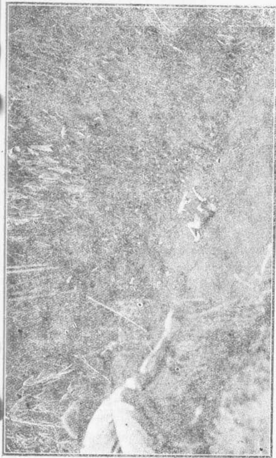
Siapakah itoe prampoean dan anak lelaki beroesia anem atawa toedjoe taon?

Di djalanan jang menoedjoe ka Kalibening, kita ketemoeken korban-korban pertama dari ini bintjana jang terdjadi pada itoe sa'at jang heibat dari hari Djoemahat malem Saptoe. Satoe anak beroesia anem atawa toedjoe taon, ada terletak di detet soengei dengan tjelentang. Moekanja tida bisa dikenalin, soedah terbakar dan angoes sama sekali. Kira satoe satenga meter djaoenja kadapetan satoe prampoean jang rebah tjelentang, tangannja dilengkorken atas kepalanja dan moeloetnja terboeka. Mata, idoeng dan moeloetnja ada penoeh dengan aboe. Pakeannja tjoemah satoe kaen batik jang terlipet di pinggangnja. Badjoenja tentoe soedah dilemparken dalem pergoeletannja dengan tangan kamatian, dalem mana itoe prampoean telah dikalahken. Lebih djaoe djalanan dihalangin oleh batang batang poehoen bamboe jang rebah, dan di blakang itoe kita liat mait dari satoe iboe dengan anaknja. Itoe anak soedah digendong sampe di sa'at pengabisan, lantes didjatohken, tjoemah bebrapa decimeter dari iboenja sendiri."