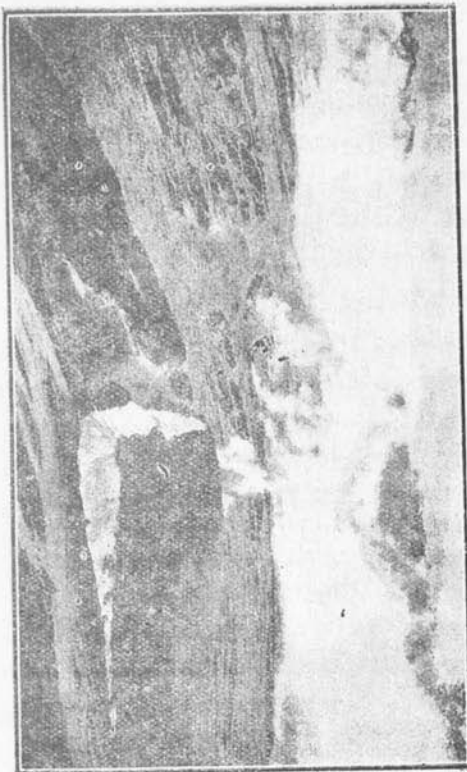
DI DJOERANG BLONGKENG.