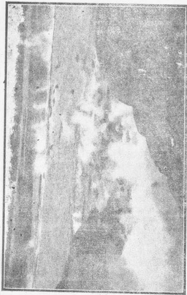
Tepi djoerang Blongkeng jang padet dengan lahar panas.