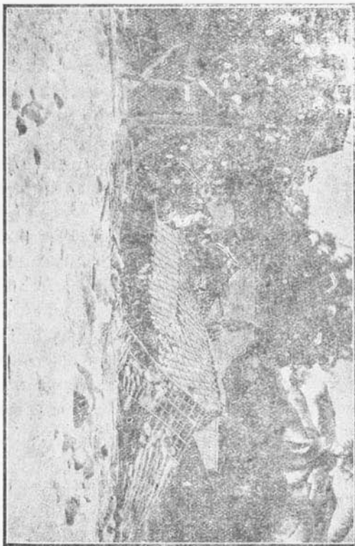
Roemahnja Loerah Gadjoggan, dimana Opzichter dan dea Mauri dari Vulkanologischen Dienst telah tertoepeet dari kamatian dengan satjara moedjijat.