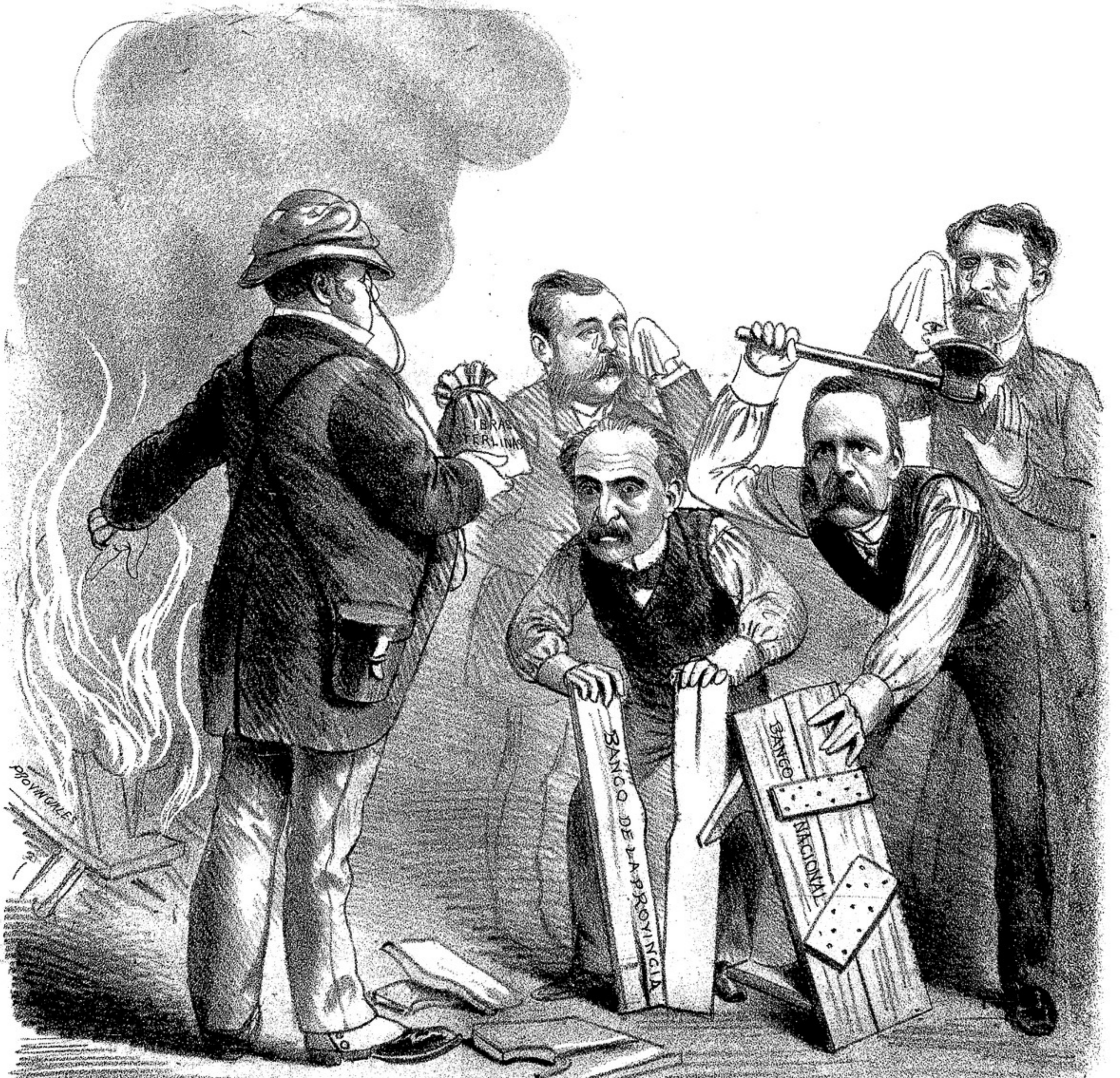
JOHN BULL ORDENA QUE LOS BANCOS OFICIALES SEAN REDUCIDOS A CENIZAS ASI PREVALECERAN EN ABSOLUTO EL BANCO DE LONDRES Y LAS ORDENES DE LA CITY.