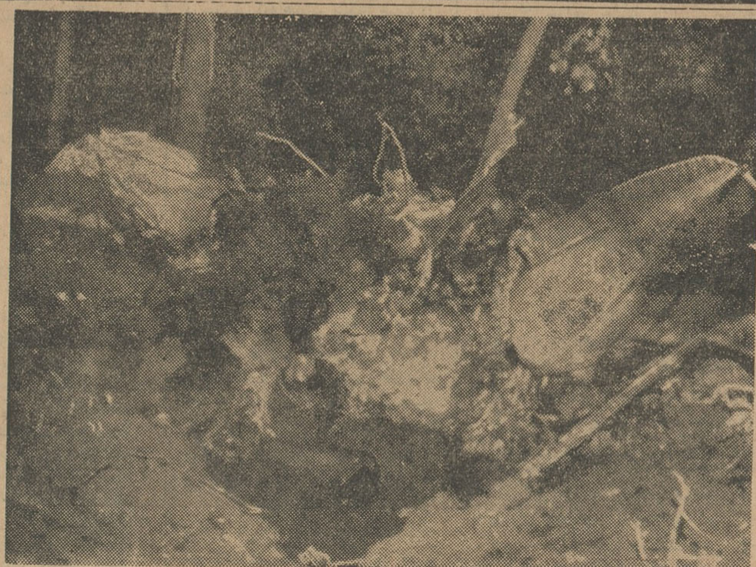
لاشه هواپیما که بکلی متلاشی شده است