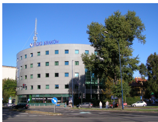
радіо (1.4) у Кракові