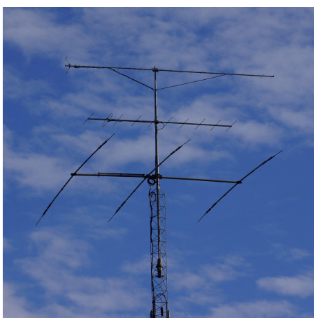
антэна для передавання інформації по радіо (1.1)