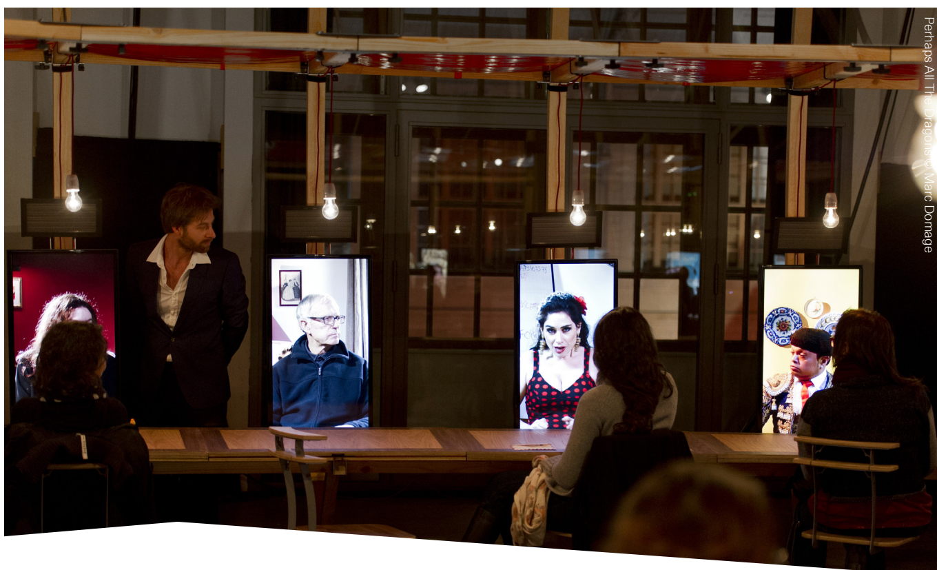
Perhaps All The Dragons

op samen met Caroline Rochlitz. Ze startten de serie 'Holoceen' (het huidige geologische tijdperk) met de voorstellingen 'Jerusalem', 'Iqaluit', 'Bonanza', 'Moscow' en 'Zvizdal'. Enkele jaren later startte Berlin een nieuwe cyclus 'Horror Vacui' (angst voor de leegte) waarvan 'Tagfish', 'Land's End' en 'Perhaps All The Dragons ...' de eerste drie episodes vormen.