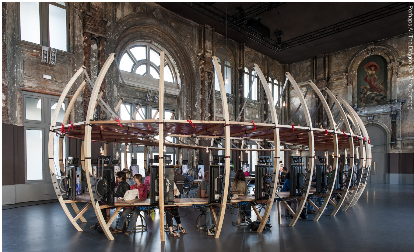
Perhaps All The Dragons

Het vertrekpunt van de projecten van Berlin situeert zich steeds in een stad of streek ergens op deze wereld. Kenmerkend zijn de documentaire en interdisciplinaire werkmethodes. Vanuit een focus op een specifieke onderzoeksvraag, maakt Berlin gebruik van verschillende media, afhankelijk van de inhoud van het project. Bart Baele en Yves Degryse richtten Berlin in 2003