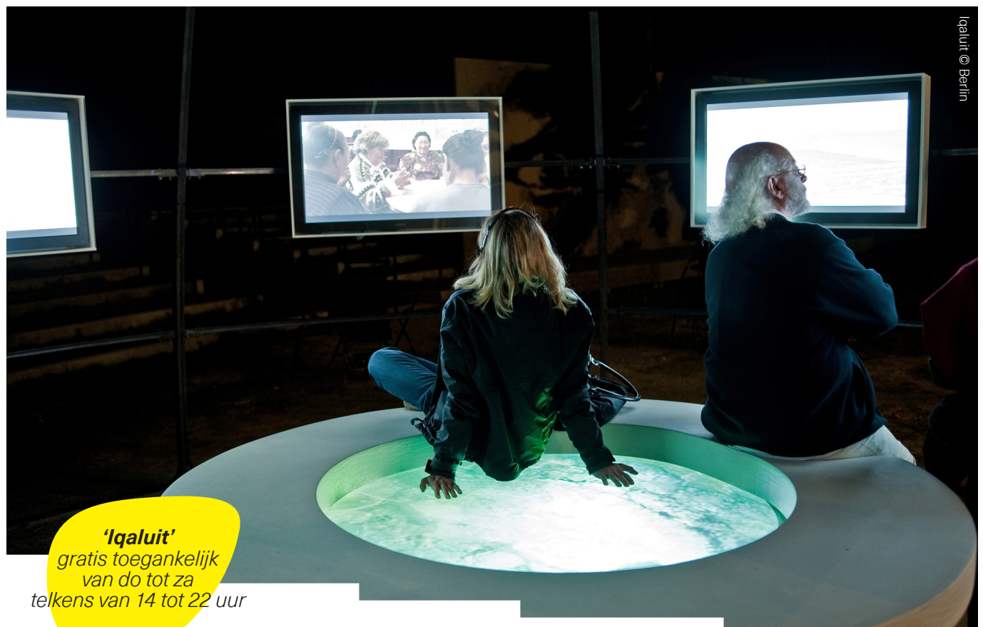
Iqaluit © Berlin

'Iqaluit' gratis toegankelijk van do tot za telkens van 14 tot 22 uur