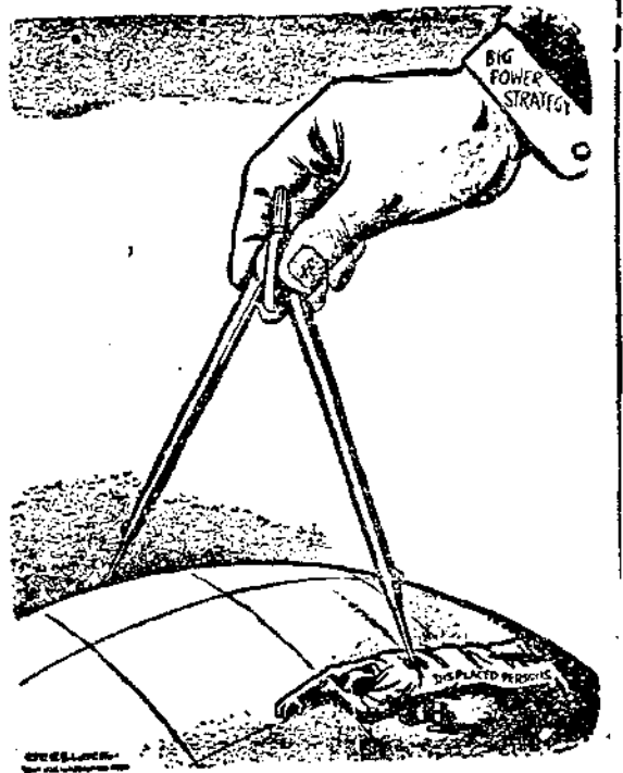
强權戰略下 的犧牲者