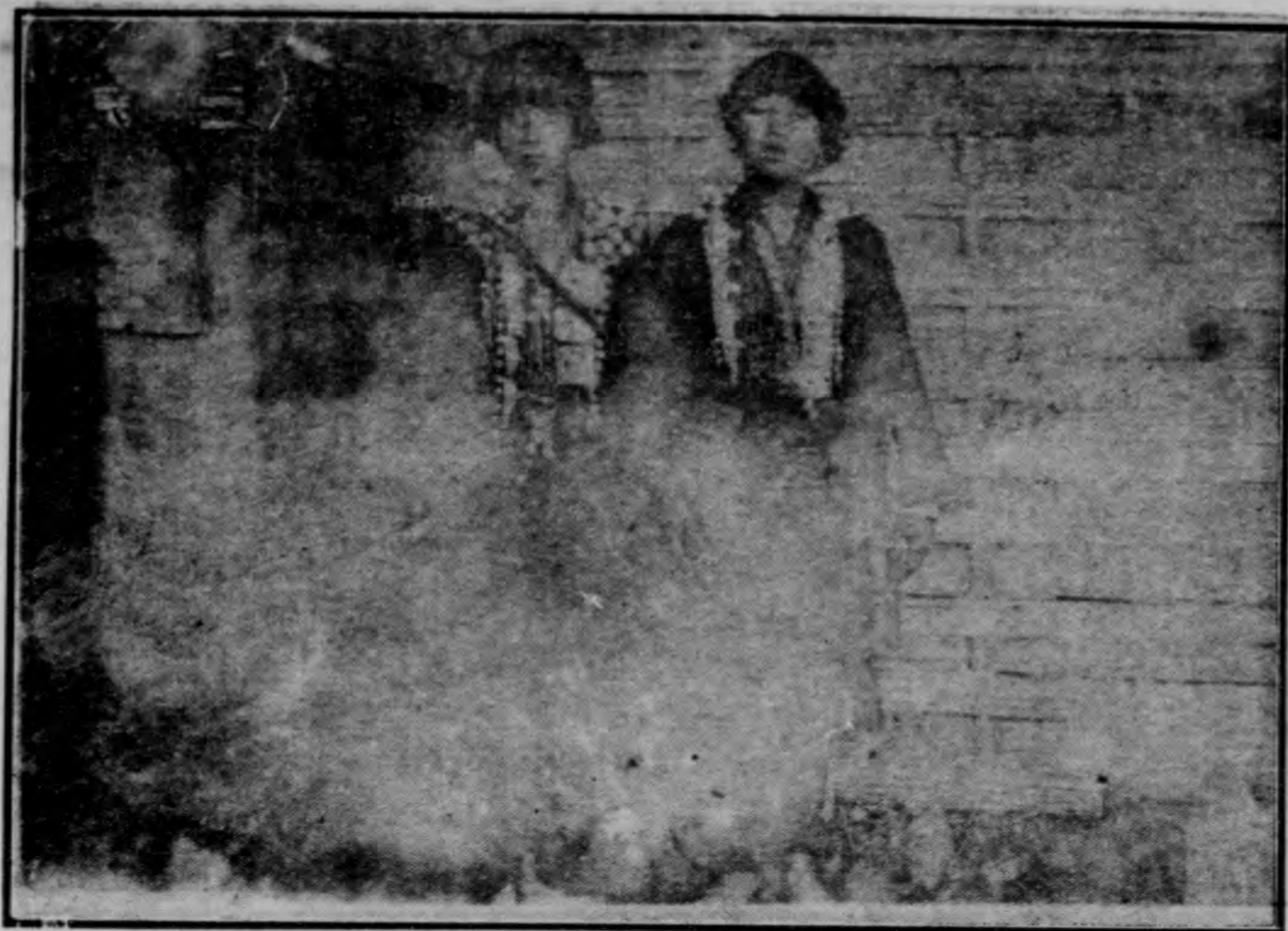
子 女 族 貴 之 中 人 野 (三 之 圖 插)