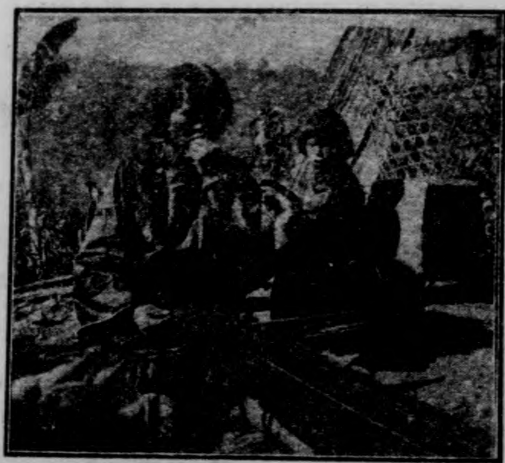
帶 織 之 子 女 人 野