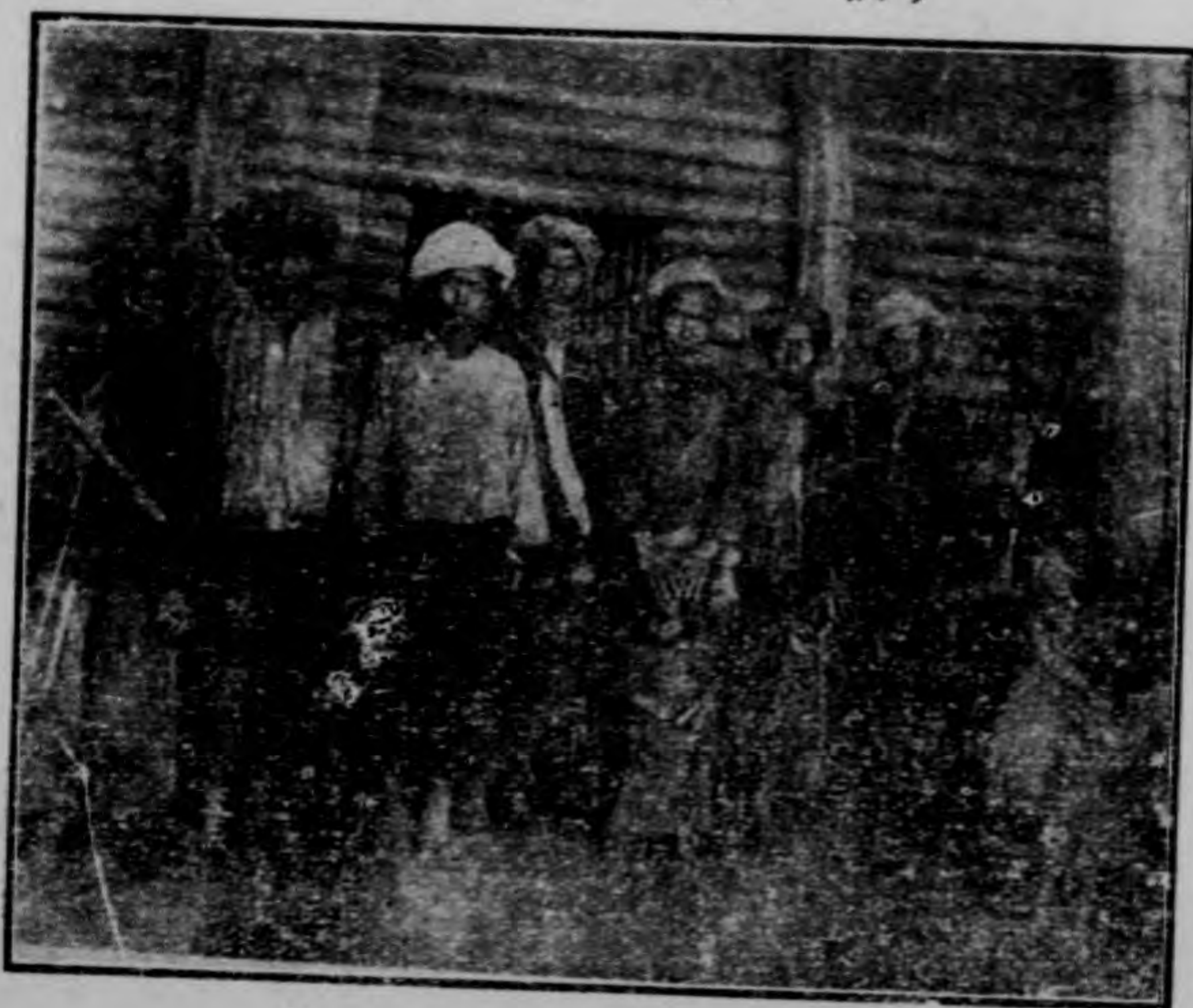
裝 本 之 人 野