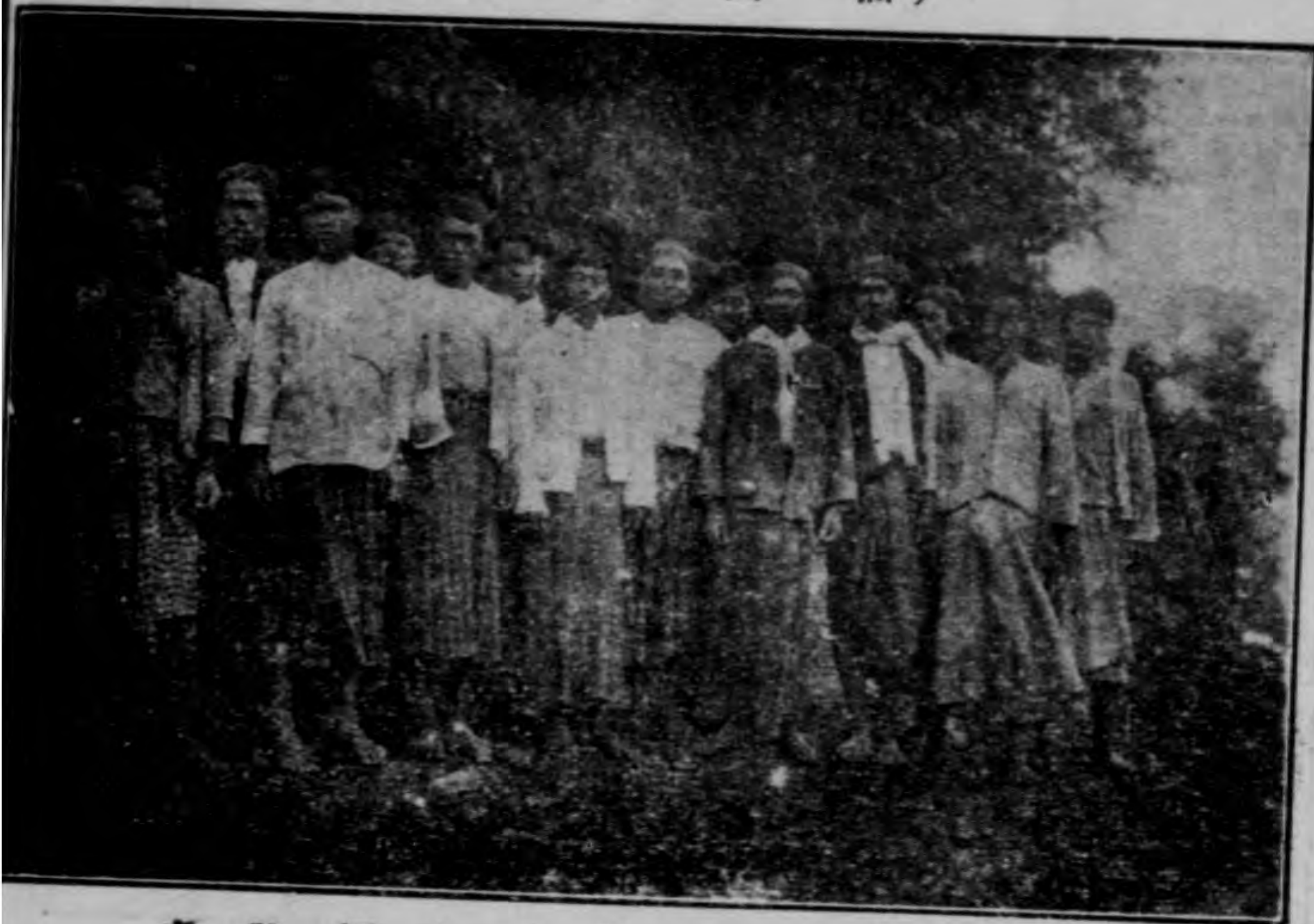
者 裝 緬 之 人 野 近 附 坡 心 江 (五 之 圖 插)