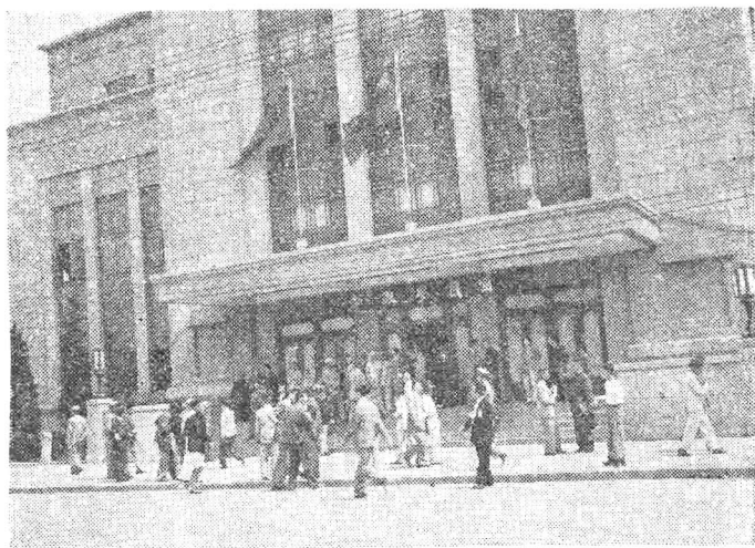
第四屆參政會第三次大會會場國民大會舉行