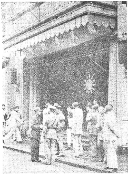
第一屆參政會第一次大會在漢口舉行