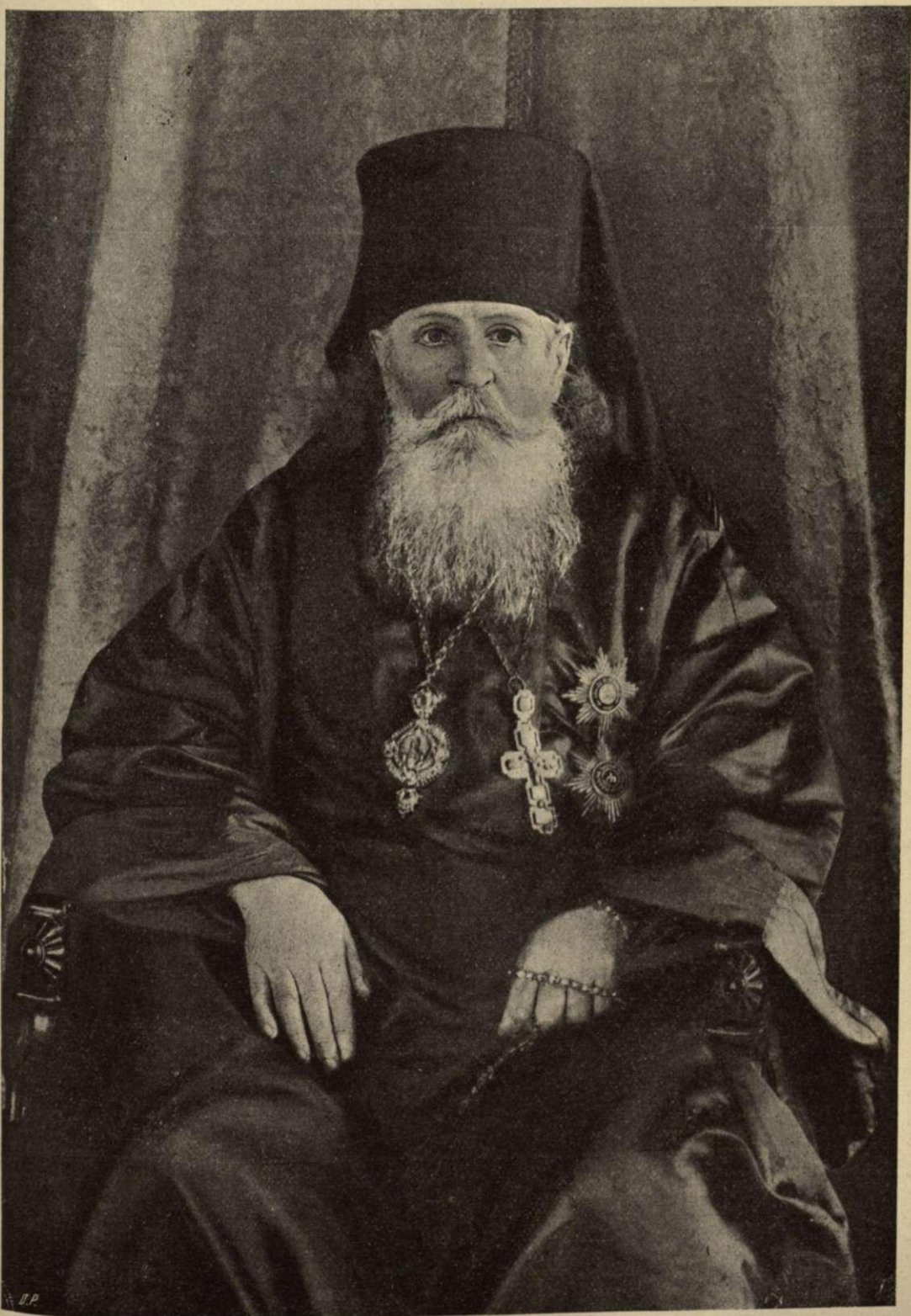
† Высокопреосвященнѣйшій Георгій, Архієпископъ Астраханскій и Енотаевскій.