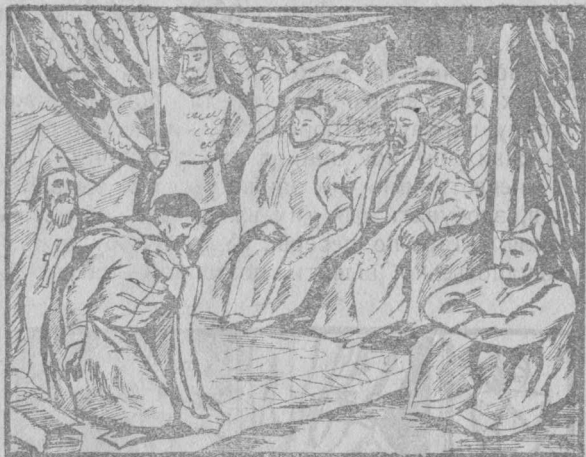
Князь із єпископом на поклоні у татарського хана.