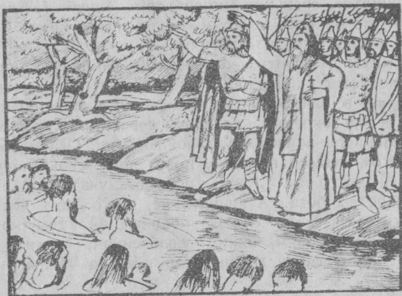
Приєднання слов'ян до християнської віри.