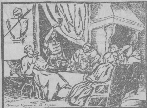
Цинкоз. Пушкинськ. 40 Харків.

Після татар, по перерві, Україну було підбито під владу польської шляхти, поміщиків—магнатів.