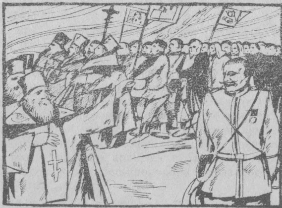
Дві підпори царату (церква й поліція).

Серед вірних знаходилися люде й групи, яким ясним ставала вся невідповідність поліцейської церкви словам про милосердя бога. Вони намагалися якось церковне життя виправити, виправити саму релігію. Так народжувалися так звані «секти» та «ересі» — групи евангелістів, баптистів, мальованців то-що. Але