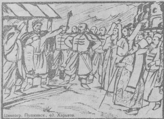
Цинкогр. Пушкінск., 40. Харькв.

Недовго проіснувала українська держава: намагалася знову собі підвернути Україну польська шляхта, змагалися за неї московські царі з боярами, зазіхали крімські хани. Селянство ж і робітництво українське не палали вже бажанням боронити владу своїх, рід-