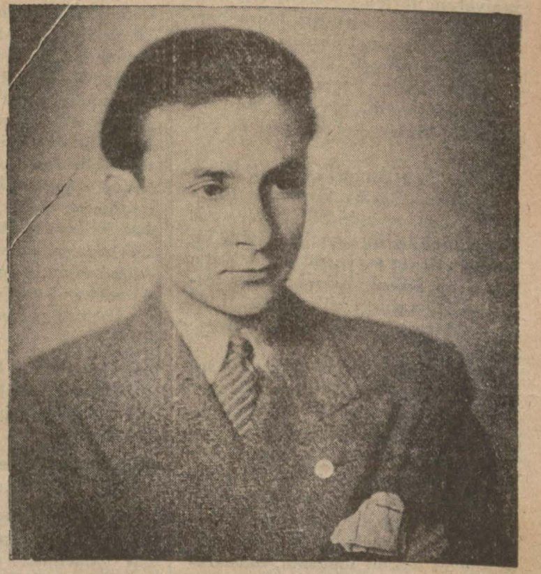
Rıza Tahsin Beyin «Cumhuriyet» e verdiği restm

İngiltere'nin sayılı zenginle- rinden birinin genç kızı, epey- ce zaman evvel vefat eden pede- rinden büyük bir servete varis ol- muştu. Genç kız bir kaç sene ev- vel gene İngil- tere'nin sayılı zenginlerinden büyük bir fab- rikatörle evlen- miş, fakat bu iz- divaç uzun sür- memiş, kocası ki- sa bir hasta- lıktan sonra geç- en sene vefat etmiştir. Bu su- yüklü bir servete tevarüs etmiştir. Genç kadın kocasının vefatını mü- teakip bir müddet İngiltere'de kal- mış ve sonra seyahate çıkmış, bir çok memleketleri gezmiştir. Genç kadın