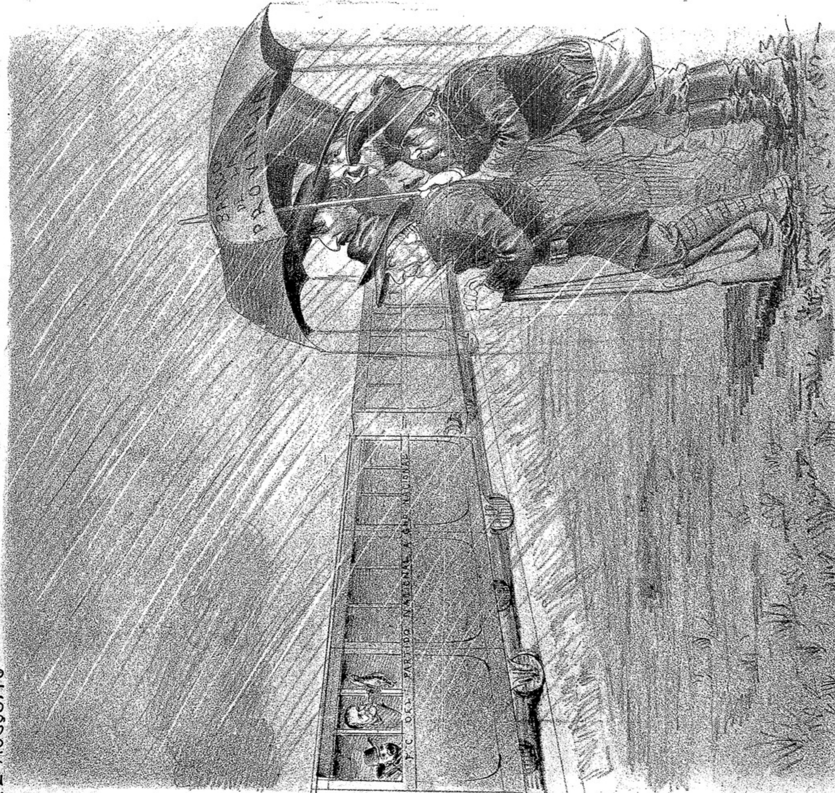
TRISTE SITUACION EN TIEMPO DE TEMPORAL, DE UNOS CAZADORES QUE ERRABAN EL TIRO... Y EL TREN.