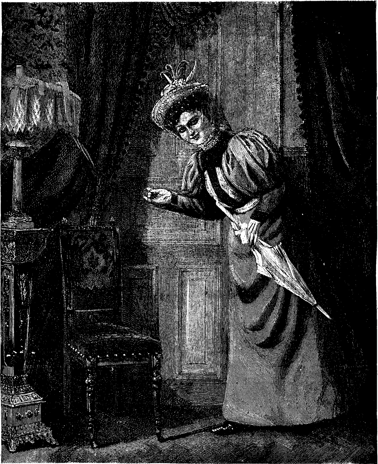
I N T R Ă ! (După tabloul lui K. Müller.)