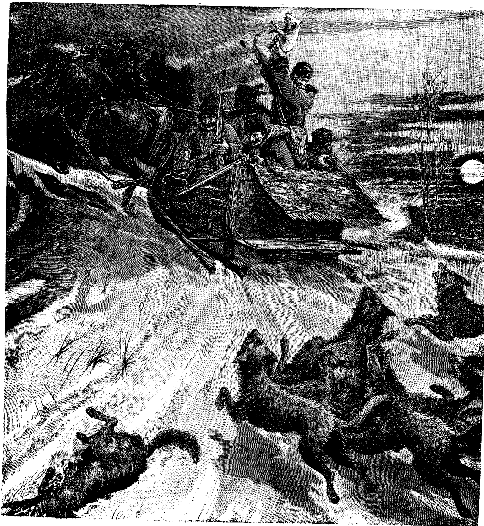
VENĂTÔRE DE LUPI IN RUSIA.