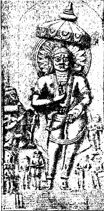
વનરાજ-( પાટણમાંની મૂર્તિ ઉપરથી ).

વનરાજને પોતાની સત્તા પૂર્ણ જામ્યા પછી રાજધાનીનું શહેર વસાવવાની ઇચ્છા થઈ. પોતાના જંગલના મિત્ર અણુહીલ ભરવાડને લઈને તે જગ્યા જોવા નીકળ્યો. સરસ્વતીને કિનારે