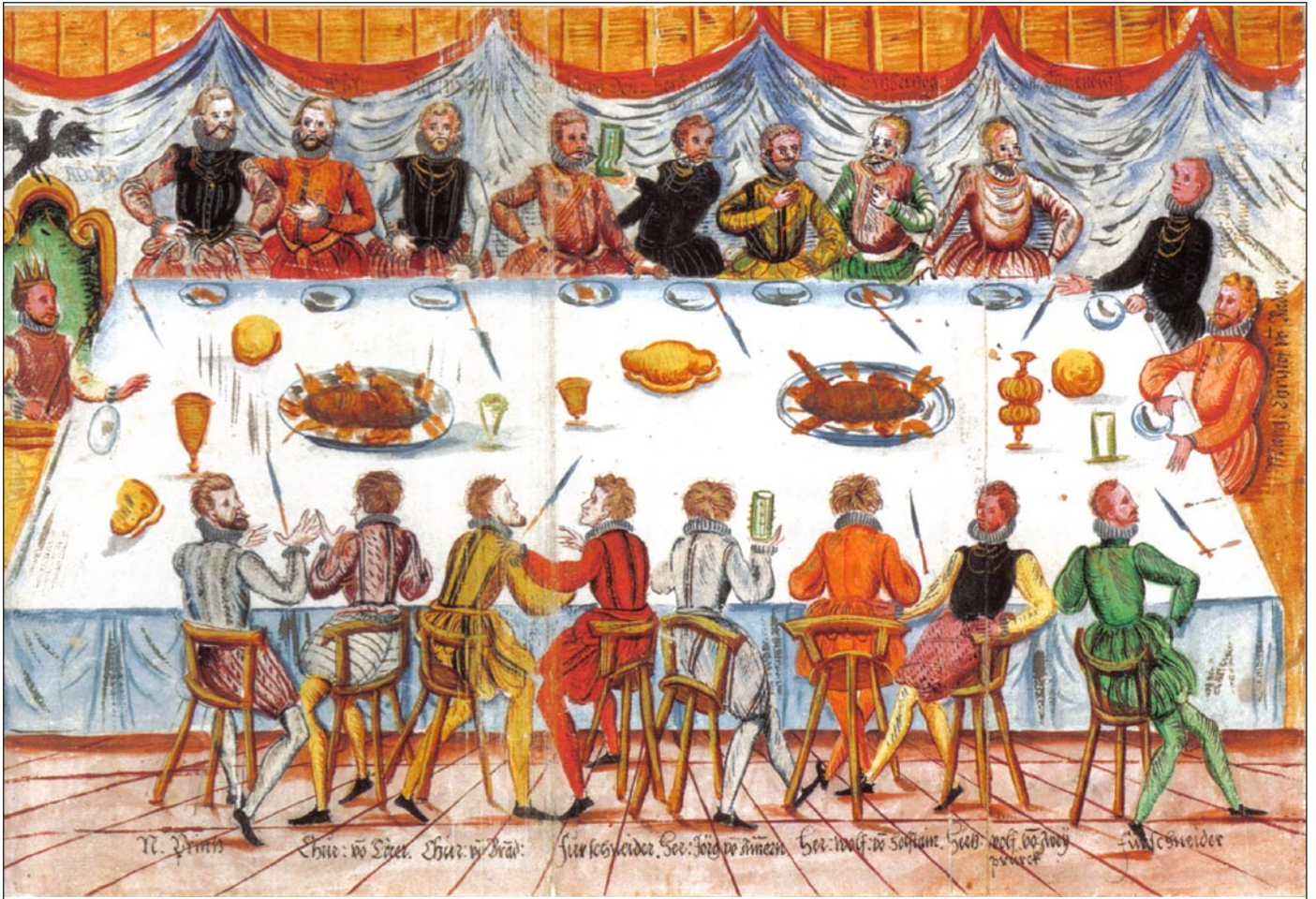
Krönungsmahl Kaiser Ferdinands I. im Frankfurter Römer 1558