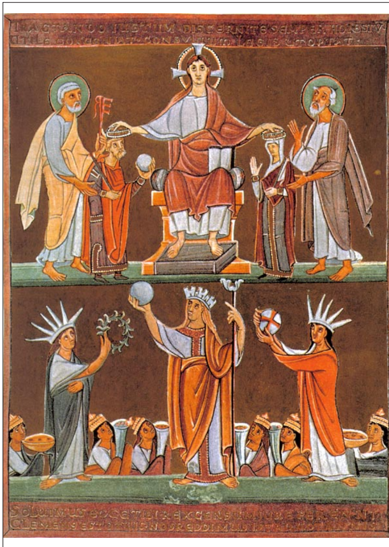
Kaiser Heinrich II. und seine Gattin Kunigunde, Darstellung aus dem Perikopenbuch Heinrichs, 11. Jahrhundert