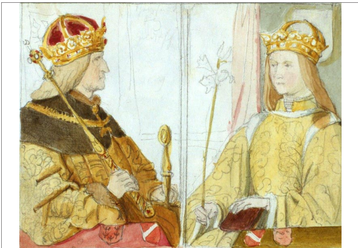
Kaiser Friedrich III. und seine Frau Eleonore von Portugal, Zeichnung aus dem Skizzenbuch Eduard Julius Friedrich Bendemanns, um 1850