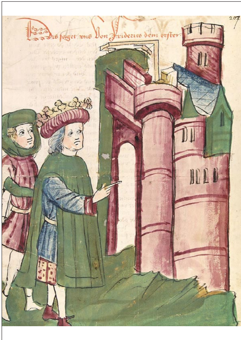
Friedrich I. Barbarossa vor der Stadt Tivoli, die er wieder aufbauen ließ, Darstellung aus der „Chronicon pontificum et imperatorum“, um 1450