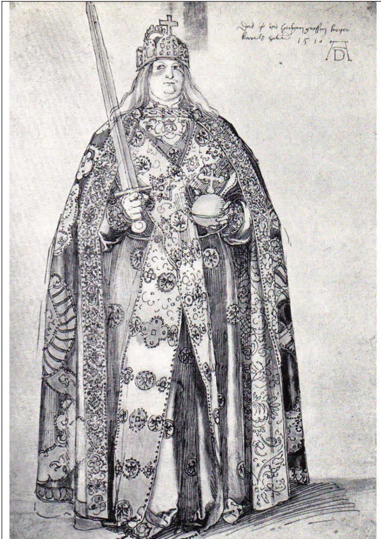
Karl der Große mit den Reichskleinodien, Studie zu einem Gemälde von Albrecht Dürer, um 1510