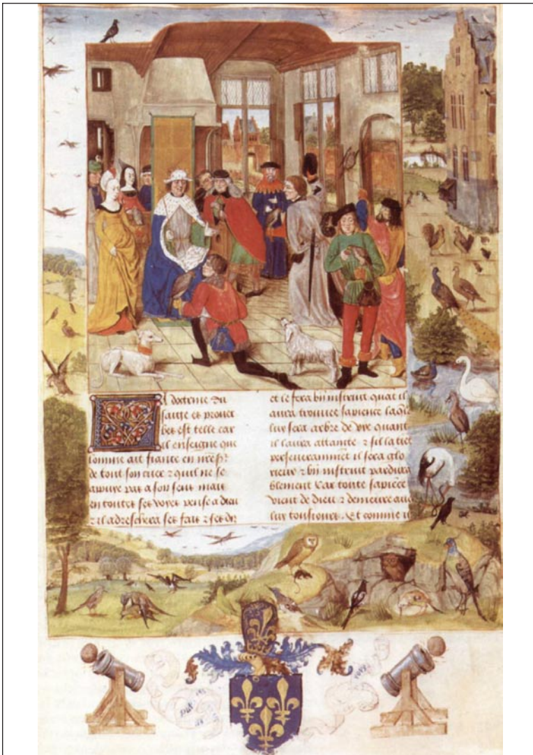
„Buch der Falknereikunst“ von Kaiser Friedrich II., ihm wird ein Falke überreicht, unbekannter Meister aus Brügge von 1482